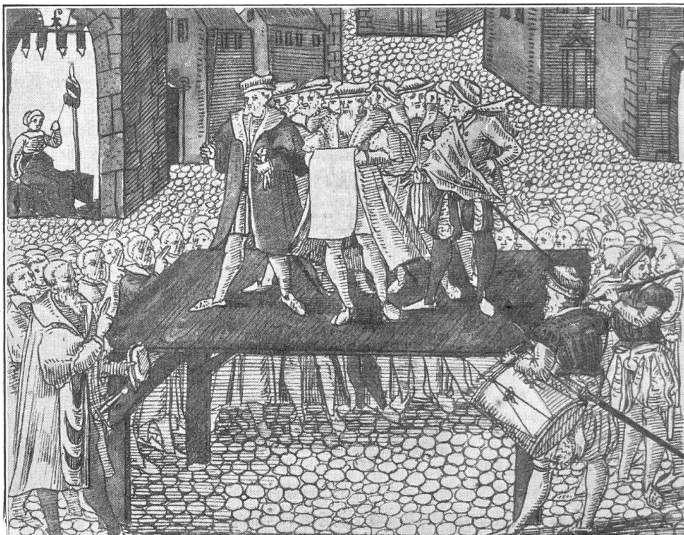
Bild 3. Basler Bundesschwur 1501; nach Silberisens Schweizerchronik 1576, in der Kantonsbibliothek Aarau. Oben links Spinnerin unter dem Stadttor. Cliché aus dem Lesebuch «Heimatboden», Solothurn 1946.

Von Liestal herkommend, reiten sie gegen das Aeschentor. Knaben springen ihnen entgegen und rufen: «Hie Schweiz Grund und Boden und die Stein in der Bsetzi!» Am Tor stehen die Ratsboten mit schimmerndem Trinkgeschirr. Sie bieten den Eidgenossen den Ehrentrunk. Die Torflügel aber stehen heute weit geöffnet, und an Stelle der geharnischten Knechte, die seit Jahren