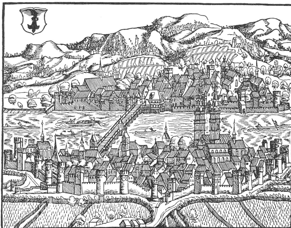
Bild 3. Basel im 16. Jahrhundert. Aus der Schweizerchronik von Johannes Stumpf, Zürich 1547/48, Blick von Grossbasel gegen Kleinbasel.

Wenn die Stadt heute in kultureller und wirtschaftlicher Beziehung ein so blühendes Staatswesen vorstellt, so ist daran nicht nur (wie bei der Gründung)