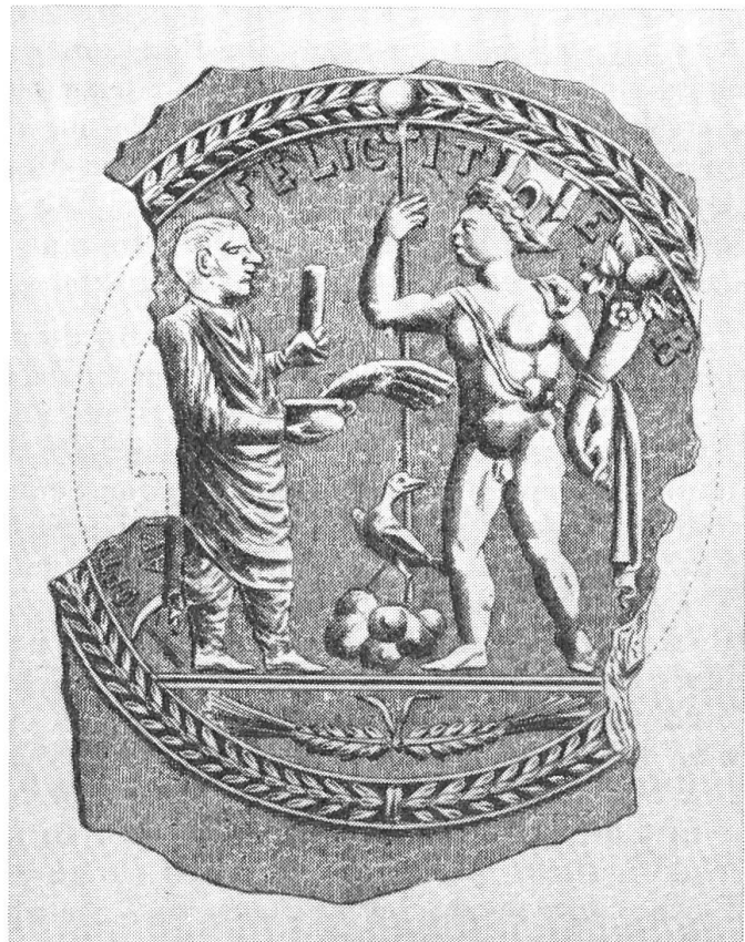
Bild 2. Römische Münze: Munatius Plancus und der Genius der Stadt Lyon.

Um die Mitte des 4. Jahrhunderts machten die Alemannen neue Anstrengungen, die Rheinlinie in ihren Besitz zu bringen, bis 357 Julian in der Nähe von Strassburg dem germanischen Stamm eine gewaltige Niederlage beibrachte und die Rheingrenze vorübergehend sicherstellte. Valentinian fügte dem System der Kastelle aus konstantinischer Zeit neue Glieder ein und machte die