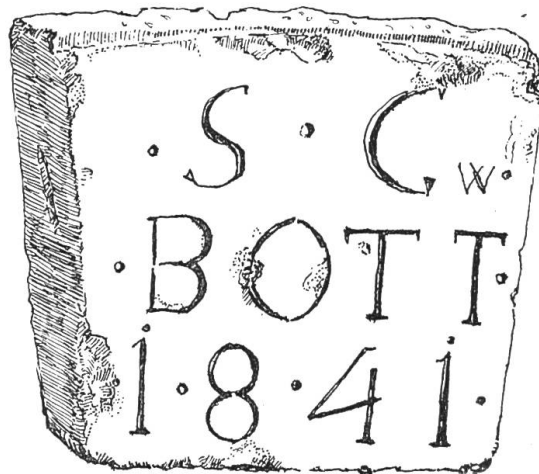
Türsturz des Scheunenbogens der Metzgerei Grauwiler in Lausen. Federzeichnung Gustav Müller.

Wo sich heute in der Metzgerei zum «Rössli» zu Lausen die Fleischhalle oder Schol befindet, war früher eine Scheune, und wer Fleisch kaufen wollte, der musste auf Umwegen zur Schol gelangen, die sich hinter der Scheune befand. Im Jahre 1913 hat ein Umbau den heutigen Zustand geschaffen. Aber es sei hier lobend erwähnt, dass die Familie Grauwiler den Schlußstein des