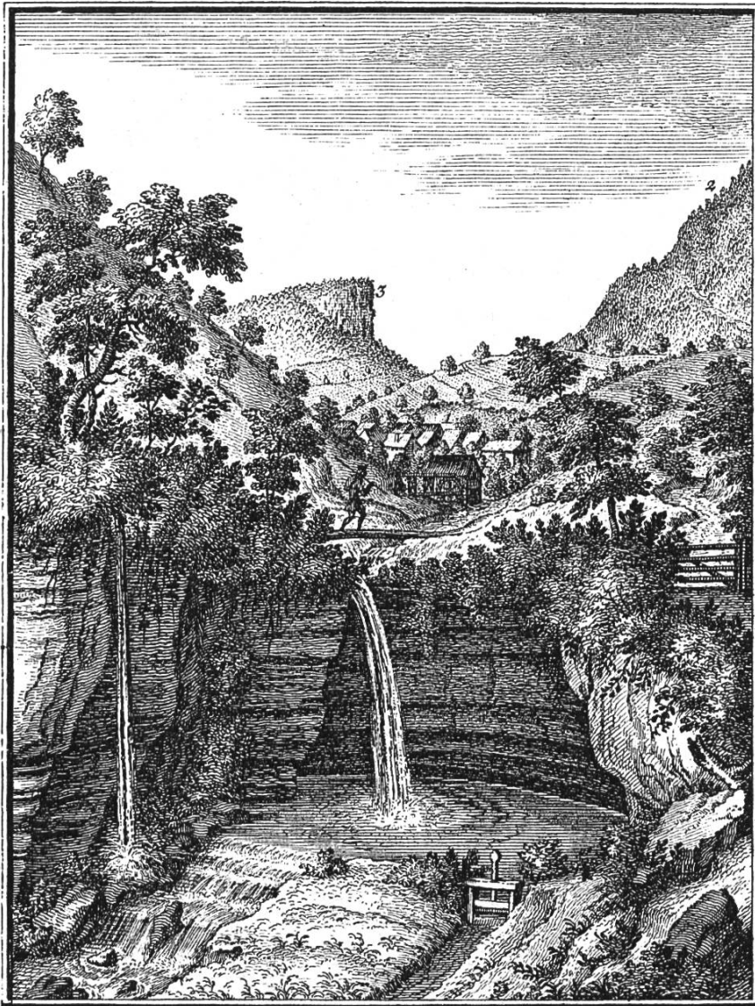
Bild 1. Der Giessen bei Zeglingen. 1 Zeglingen, 2 östlicher Abhang des Wisenberges, 3 Wisenflue. Nach einem Kupferstich, entworfen von Em. Büchel, gestochen von J. R. Holz- halb, in D. Bruckners Merkwürdigkeiten, Basel 1757.

tigem Geräusch herab und wässert das ganze Tecknauer Thal bis naher Gelterkinden. Das unter dem Giessen liegende Thal, so das fruchtbarste Wiesengelände, ist von reizender Schönheit und Anmuth.» Nach dem Kupferstiche Em. Büchels (Bild 1) bildete schon im 18. Jh. der Bach eine Gumpe, dort nahm ein Wassergraben seinen Anfang. Spuren dieser Bewässerungsanlage sind noch heute sichtbar; auch soll nach Tr. Meyer 3 der Kolk als «Ross-Schwemmi» benützt worden sein. An Sonntagen tummelten sich daselbst die Burschen der umliegenden Dörfer mit ihren Pferden.