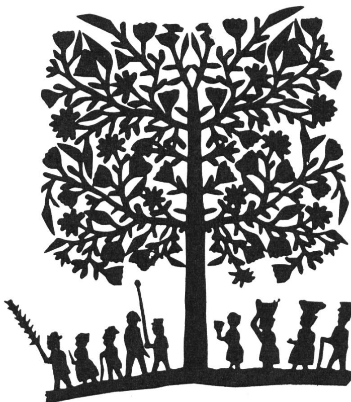
Bild 3. Blütenbaum (Faltschnitt) und ländliche Figuren (Scherenschnitt).