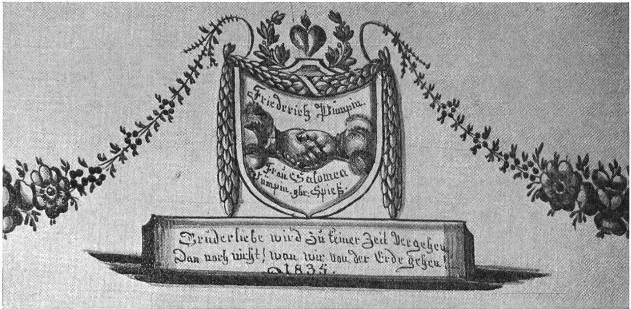
Bild 1. Widmungs-Ofenkachel vom Gasthaus zum Ochsen in Gelterkinden, nun im Haus von Fritz Pümpin-Gerster, Rickenbacherstrasse 2, Gelterkinden.

Gute Bürger in jedem Stand Sind treue Freunde am Vaterland.