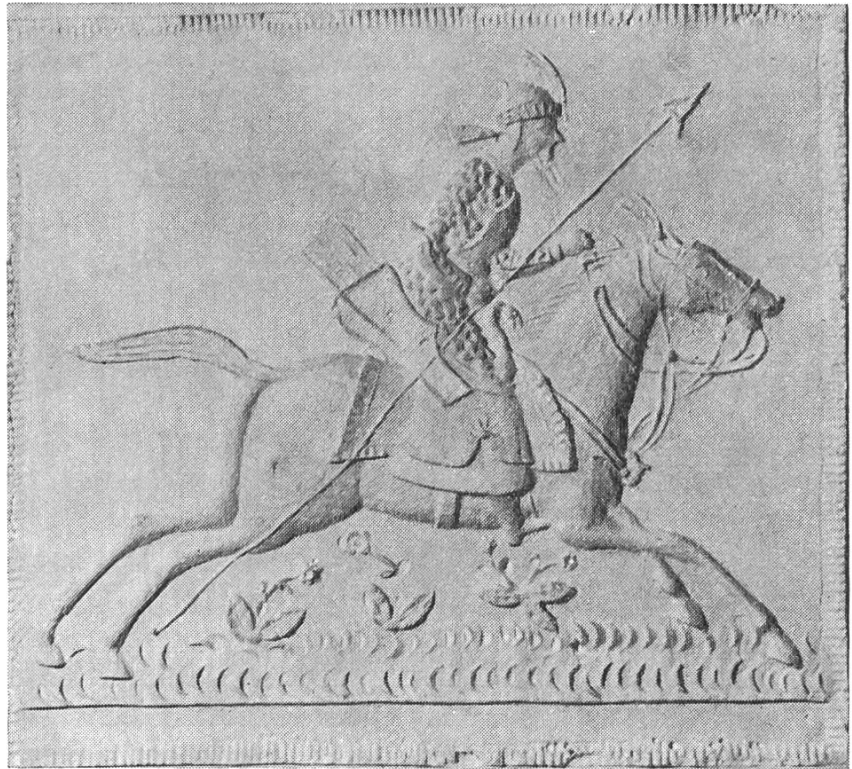
Bild 3. Backmödeli aus Sissach mit reitendem Kosak.

tenfahrt («Vogt» als lat. vocatus = der Angesprochene, verw. mit advocatus = Anwalt), «Schlitten» (aus schlüpfen, ausschlipfen = gleiten), Jonas mit dem Walfisch (wohl eher dem Leviathan?), die Flucht nach Aegypten (Flucht verw. mit Flug), die Nonne (v. ital. nonna = Grossmutter), der böse Mann, der die Kinder stiehlt usw. laden zu sinnierendem Verweilen ein. Den Kindern mag beim Gedanken an Aenisbrötli und Lebkuchen (v. lat. libium = Fladen) der Mund wässern, denn für die «Gutzi» haben sie eine Schwäche («Gutzi» nach landläufiger Meinung von «gut» 33 ). Eine immer wiederkehrende Darstellung ist das Wickelkind oder Buschi (wahrscheinlich von «Büschel» oder Bündel, weil das Buschi in Windeln — von winden — eingewickelt ist). Ist «fäschen», das früher übliche straffe Einwickeln des Säuglings, wohl mit got. fano = Tuch zu erklären?