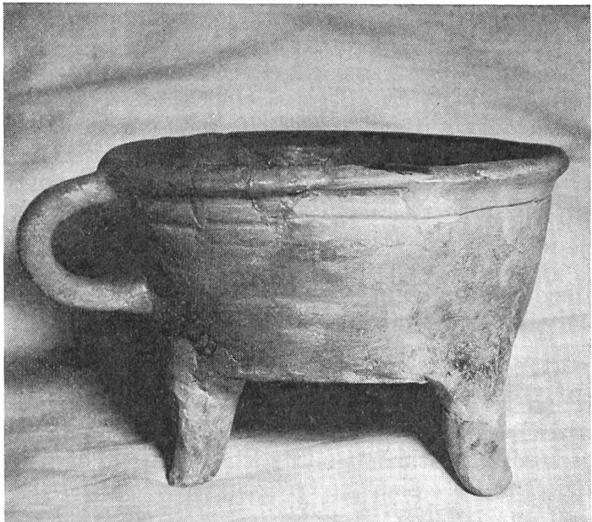
Bild 4. Tüpfi mit Henkel, innen glasiert, aus rotem Ton. Aus dem Fundinventar der mittelalterlichen Burg Bischofstein.

mit Kapuze, folgte im Französischen «chapeau», woraus das deutsche «Kappe» entstand und schliesslich die schweizerische Mundartform «Chäppi». Als «képi» wurde das Wort daraufhin wieder vom Französischen übernommen (eine andere Variation ist das schweizerdeutsche «Tschäppel»). «Mütze» geht hervor aus arab. mustakah = Pelzmantel, welcher Urform unser Dialektausdruck «Mutz» in seiner Bedeutung näher kommt 36 .