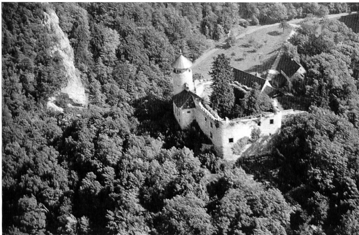
Bild 1. Schloss Birseck und Weidhof, Flugbild von Südwesten. Gut sichtbar ist die hohe Umfassungsmauer, links mit Wehrgang und Zinnen. Vor dem Turm die Schlosskapelle.

Unter-Birseck, das wir hier betrachten, wurde, wenn wir von einer kurzen Verpfändung absehen, nie in das Feudalsystem eingegliedert. Es blieb im Besitz des jeweiligen Landesherrn, also des Fürstbischofs von Basel, der vielfach hier residierte (in ähnlicher, wenn auch nicht gleicher Weise, wie es in Zabern für den Strassburger, in Meersburg für den Konstanzer Bischof der Fall war). Ausserdem residierten die späteren bischöflichen Landvögte auf Unter-Birseck, das seit der Umbenennung der obern Burg in «Reichenstein» nur noch Birseck heisst, wie es fortan hier ausschliesslich genannt wird. Zur Vogtei Birseck gehörten damals ausser Arlesheim und Reinach die Dörfer Oberwil, Therwil, Ettingen, Allschwil und Schönenbuch. Im Dorf Arlesheim hatte der Vogt seine Gewalt mit den Reichensteiner Herren zu teilen. Für die kleinen Gebiete, die das Fürstbistum im heutigen Staate Baden beherrschte, wie Istein und Schliengen, hatte der Landvogt periodisch den Fahneneid abzunehmen, wozu die Waffenfähigen dieser rechtsrheinischen Gebiete alle fünf Jahre in Arlesheim zu erscheinen hatten.