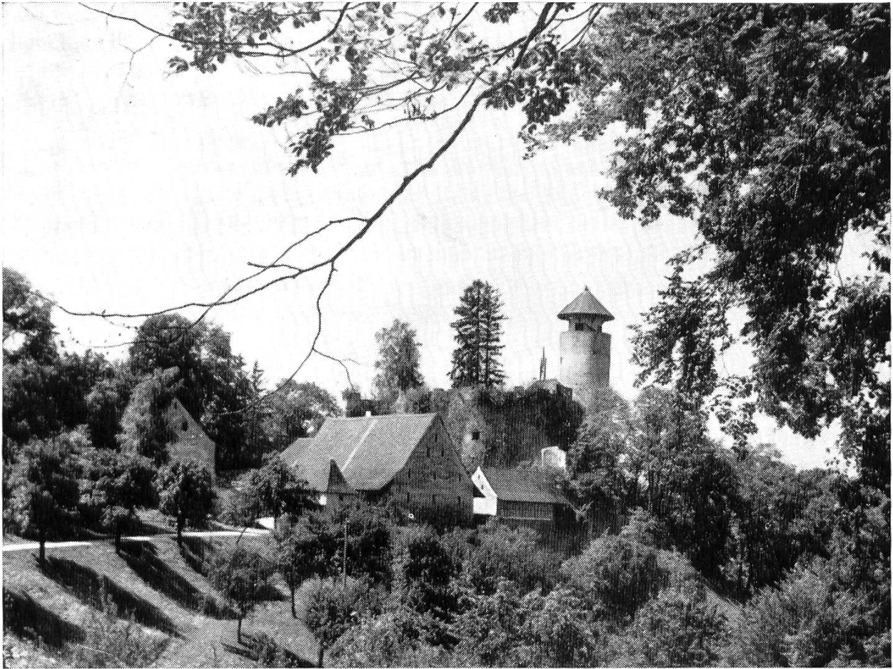
Bild 5. Weidhof oder Unterer Burghof von Osten. Auf dem Bergfried kegelförmiges Dach, darunter Rundgang, Storch als Wetterfahne.

geschlossen gewesen wäre, hätten die Angreifer dort zwischen der zuletzt genannten vorstossenden Mauer und diesem Zwingertor sich gestaut und hätten aus einem direkt über diesem schmalen Platz oben auf der Bergmauer angebrachten Gusserker mit heissem Pech, Oel oder Wasser begossen werden können. Dieser Gusserker ist ein kleiner Riegelbau und nur durch schräge Balken, nicht steinerne Konsolen, gestützt.