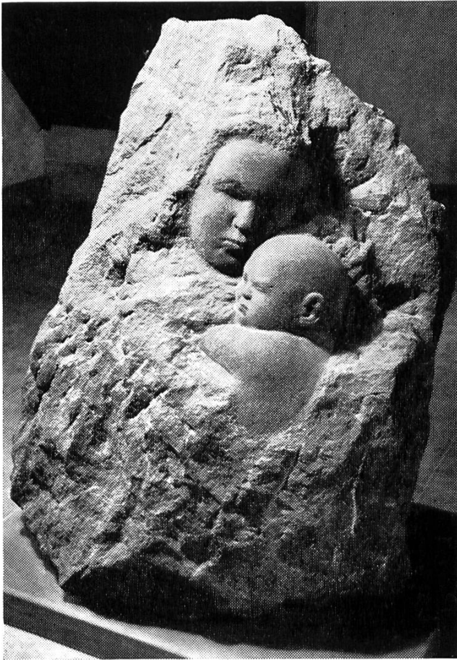
Bild 4. Taufstein in der Kirche Reigoldswil. Granit aus Andeer mit Halbrelief «Mutter und Kind», von Jakob Probst, 1935. Geschenk des Künstlers an die Heimatgemeinde.