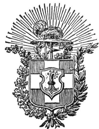
Bild 4. Kantonswappen als Herzschild des Schweizerwappens. Aus einer Verordnung vom 30. Juli 1834. Aus «Gemeindegewappen von Baselland», S. 17, Bild 5.

Nach dem Tagsatzungsbeschluss vom 3. August 1835 bittet der eidgenössische Vorort am 4. November 1835 den neuen Kanton, die Standesfarben mitzuteilen. In einer Stellungnahme der Justiz- und Polizei-Commission des Kantons Baselland vom 12. November 1835 wird festgestellt, dass, «da die Kantonsfarbe noch nie durch den Gesetzgeber bestimmt wurde, wir es für angemessen erachten, dem hohen Landrathe den Vorschlag zu machen, die bis anhin adoptirte Farbe roth und weiss als Standesfarbe zu erklären und alsdann diesen Beschluss dem hohen Vororte mitzuteilen». In einer Mitteilung an Bern er-