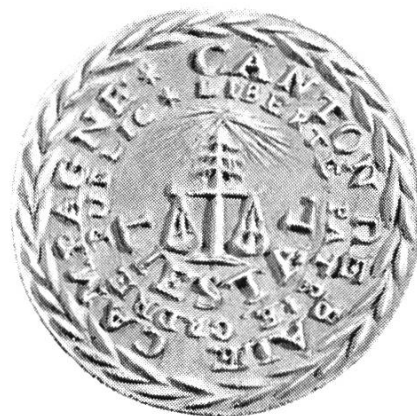
Bild 1. Siegel «Canton de Bâle Campagne», wahrscheinlich von der Provisorischen Regierung von 1831 verwendet, Durchmesser 40 mm. Aus «Gemeindewappen von Baselland», S. 19, Bild 7.

Die 1831 ausser Landes ins Exil gegangene «Provisorische Regierung» besass ein Siegel mit typischen Revolutionselementen: Waage, Freiheitsbaum und Stern mit Strahlenkranz. Die Umschrift lautet: Canton de Bâle-Campagne; der innere Kreis bringt die Worte: Liberté, Patrie, Ordre Public, Liestal. Dies Siegel (40 mm) zeigt sonst kein Wappen. Aber der Name Liestal deutet darauf hin, dass dieser Ort als der eigentliche Mittelpunkt der Unruhe anzusehen ist (Bild 1).