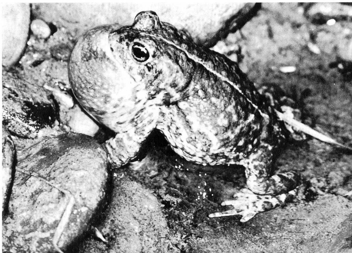
Bild 2. Männchen der Kreuzkröte steht rufend am Rand eines Kiesgrubentümpels. Besonderes Kennzeichen der Kreuzkröte: die auffallende gelbe Rückenlinie.

Unser lautester Lurch ist die Kreuzkröte . Sie besitzt auch die mächtigste Schallblase, die fast zur Grösse des Rumpfes mit Luft gefüllt werden kann. Diese hübschen Kröten, deren heller gelber Rückenstreifen sie gut kennzeichnet, treffen wir an flachen Tümpeln von Lehm- und Kiesgruben und in deren Umgebung an. Ueberraschen wir eine Kröte an Land, so erkennen wir sie auch daran, dass sie behende läuft und nicht hüpfet. In lauen Frühlings- und Frühsommernächten hören wir fast kilometerweit den Ruf der Männchen. Wenn wir an einem solchen Abend in die Nähe des flachen Wassers kommen und dessen Oberfläche mit der Taschenlampe ableuchten, verstummt das laute Plärren. Die Tiere tauchen eilig weg und verhalten sich still. Verhalten wir uns einige Zeit ruhig, so beginnt irgendwo eine Kröte mit dem Rufen, und eine nach der andern fällt in das Konzert ein. Wenn wir auch eine halbe Nacht lang im unruhigen Scheine der Taschenlampe suchen, gelangen wir kaum in die Nähe eines «singenden» Männchens, weil wir die Tiere vergrämen und sie überall dort rufen, wo wir nicht sind. Wir haben mehr Erfolg, wenn wir an einem günstigen Ort die Taschenlampe auf dem Photostativ