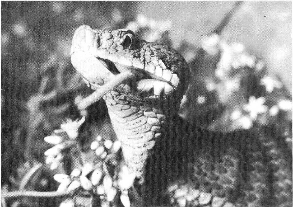
Bild 4. Weibchen der Apisviper, das eben eine Maus verschlungen hat. Der linke Unterkiefer zeigt die grosse Beweglichkeit der Kiefer. Ueber dem Mäuseschwanz die Hauttasche der Viper mit dem zurückgelegten Giftzahn.

worden. Eine Aspisviper hat eben eine Maus gefressen. Der Vorderkörper ist stark aufgetrieben, der Hals lässt die Schluckbewegung erkennen. Das herausragende Schwanzende der Maus demonstriert die grosse Beweglichkeit des Unterkiefers. Ueber dem Mausschwanz erkennt man die Hauttasche, in welcher der eingeklappte Giftzahn liegt. Ein solches Bild lässt sich im Freien kaum aufnehmen.