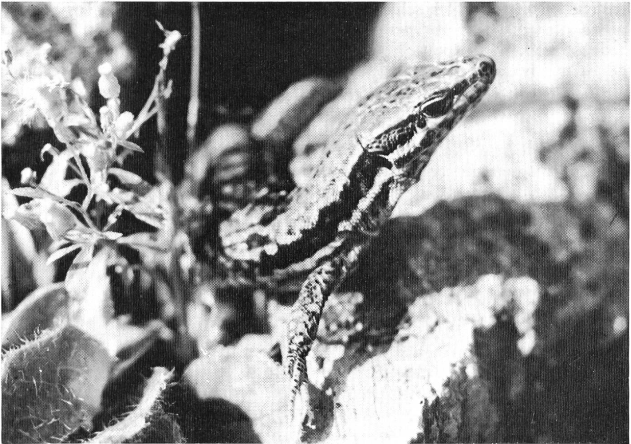
Bild 1. Männchen der Mauereidechse vor seinem Versteck in den Ruinen von Kaiseraugst.

sondern mit einem Micro-Objektiv von nur 55 mm Brennweite, das eine Annäherung auf 11 Zentimeter gestattet, was auf dem Film einer Abbildung in halber natürlicher Grösse entspricht. Die Aufnahme wird gelingen. Man muss sich gerade auf die Schnelligkeit der Eidechse stützen, die dem Tier eine Art Ueberlegenheit gegenüber einem sich bedächtig langsam nähernden Menschen gibt. Wenn man das richtig ausnützt, kommt man fast beliebig nahe an das flinke Reptil heran.