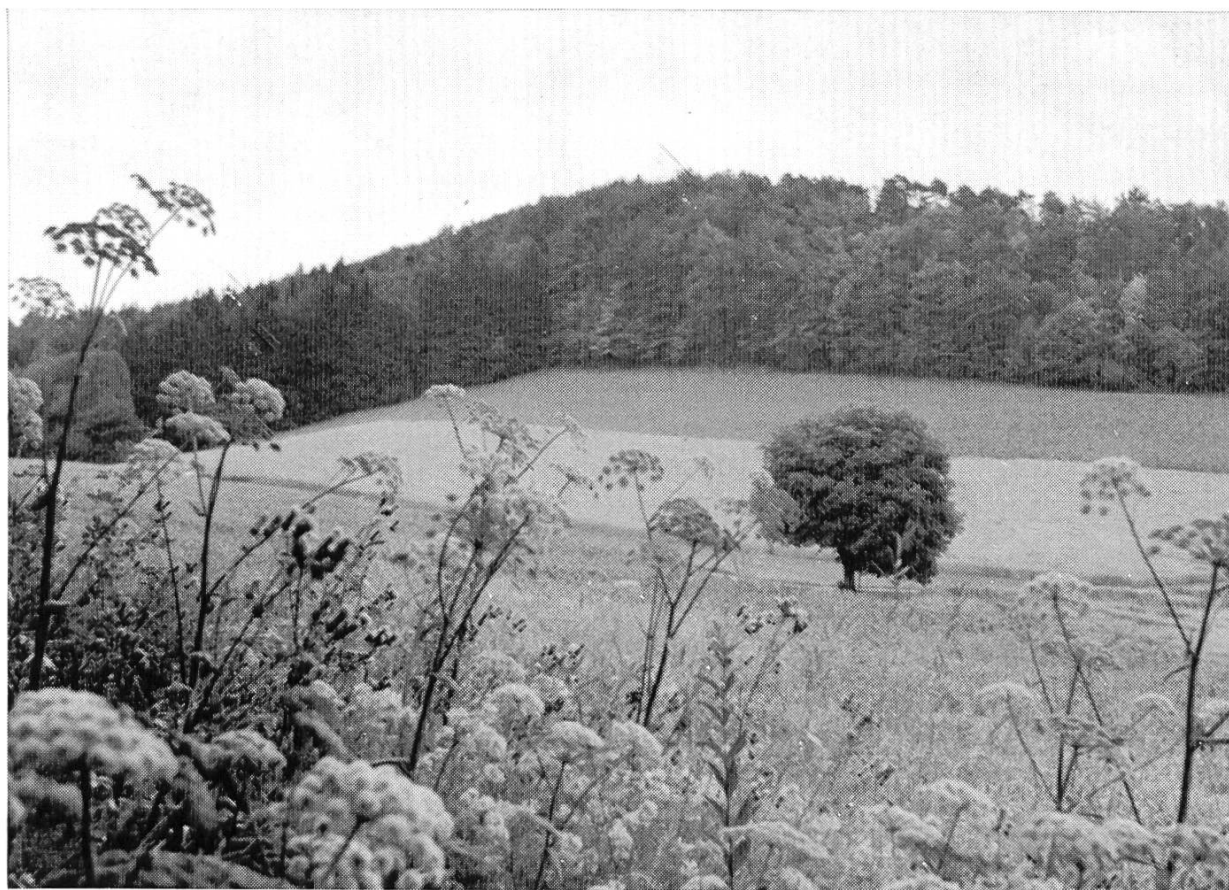
Blick vom Hinteren Holzenberg auf die Gegend Gauset—Chüeweid. Bei der Linde im Feld mündet der Weg von Reigoldswil in die Strasse Holzenberg—Seewen ein. Im Hintergrund der Waldstreifen vom Hochgauset.

4. Wenn schon die Protokolle in Schriftsprache verfasst sind, dringen doch unverkennbar dialektische Formen durch, die auch heute noch gebraucht werden: eine Pfeife Tabak eingefüllt (e Pfyfe Tubak yfülle), es ist tümber worden (zu dimbere, feischtere: dämmerig werden), Gscheüch (Gschüüch: Person mit abstossendem Aeussern, habs (das Ross) schier nicht fortbringen können (schier: beinahe), ein schwarzer Mann, der dort umher trumpe (zu trampen: plump treten), eine Heitere (e Heiteri: eine helle Stelle), es seien ihme die Haar obsich gestanden (d Hoor obsig: aufwärts gestanden, es habe etwas geschrauen (es het öppis gschroue: geschrien), sei auf Basel mit seinem Bueblin (mit sym Büeбли), er habe hören gar grüseli schreyen (grüseli: heftig, grausig), in der Dickhe eines grossen Sagbaumes (Sagbaum: entrindeter Baumstamm in der Sägerei).