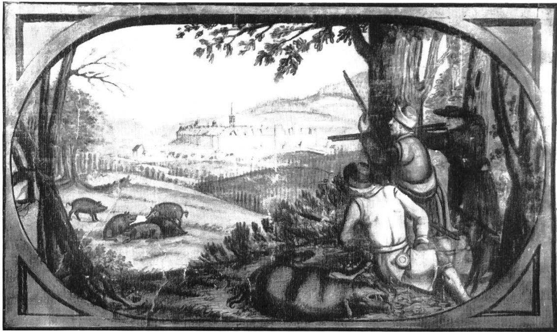
Bild 1. Ausschnitt aus G. F. Meyers Karte des Liestaler Amtes, 1679/80. Jagdszenen mit dem ummauerten Städtlein Liestal im Hintergrund, von Norden gesehen. Unteres Tor mit Brücke, links Ziegeltürmlein, rechts Pulverturm. Vor dem Städtlein Gstadig und Ergolzbrücke.

Wenden wir uns den alten, historisch gewordenen Städten zu. Die Römerstadt Augusta Raurica breitete sich in geschützter Lage auf dem Terrassensporn zwischen Ergolz und Fielenbach aus. Sie beherrschte aber auch die Strassen längs des Rheintales, die Juraübergänge Bözberg und Hauenstein und die Brücke über den Rhein. Sie war in Kriegszeiten ein wichtiger Stützpunkt, zugleich aber auch die wirtschaftliche und kulturelle Kapitale der Colonia Augusta Raurica .