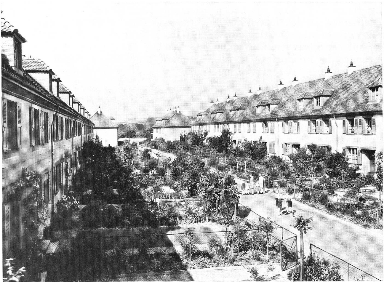
Bild 2. Eine Strasse im Freidorf, 1935.