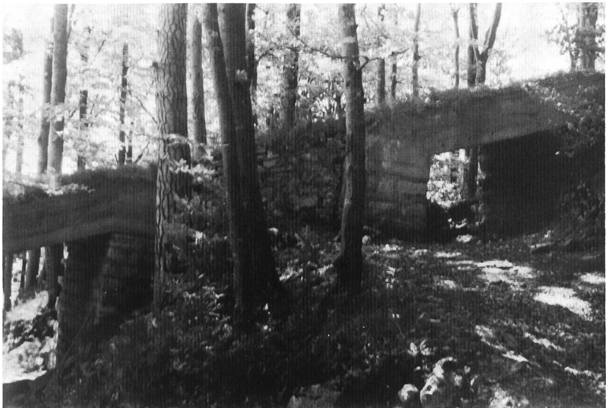
Bild 6. Artilleriestellung Walten-West.