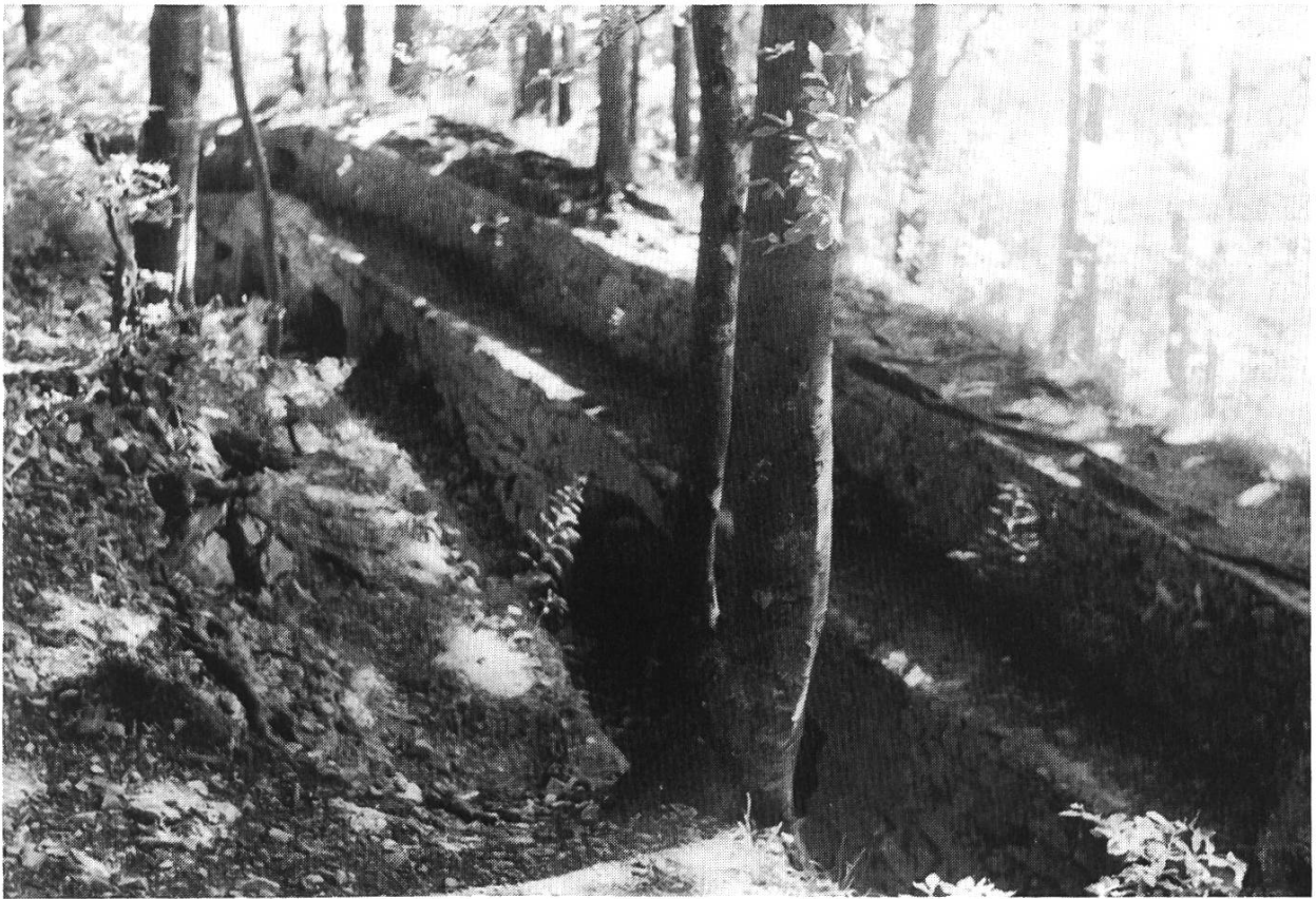
Bild 5. Laufgraben am Spitzenflüeli.