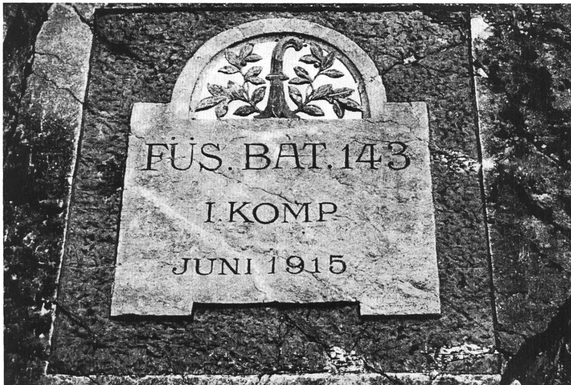
Bild 3. Belchen-Südstrasse, Inschrift: Füs. Kp. I/143 (Landwehr Kt. Basel-Landschaft).