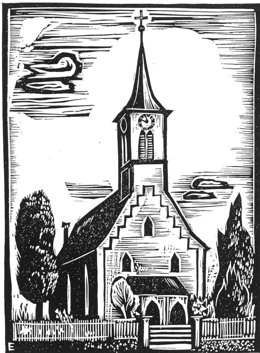
Bild 1. Die Kirche von Arisdorf. (Linolschnitt von Walter Eglin).

beiten, die ich auführte, wuchs ich im Ansehen der Behörden und der Gemeindebewohner.