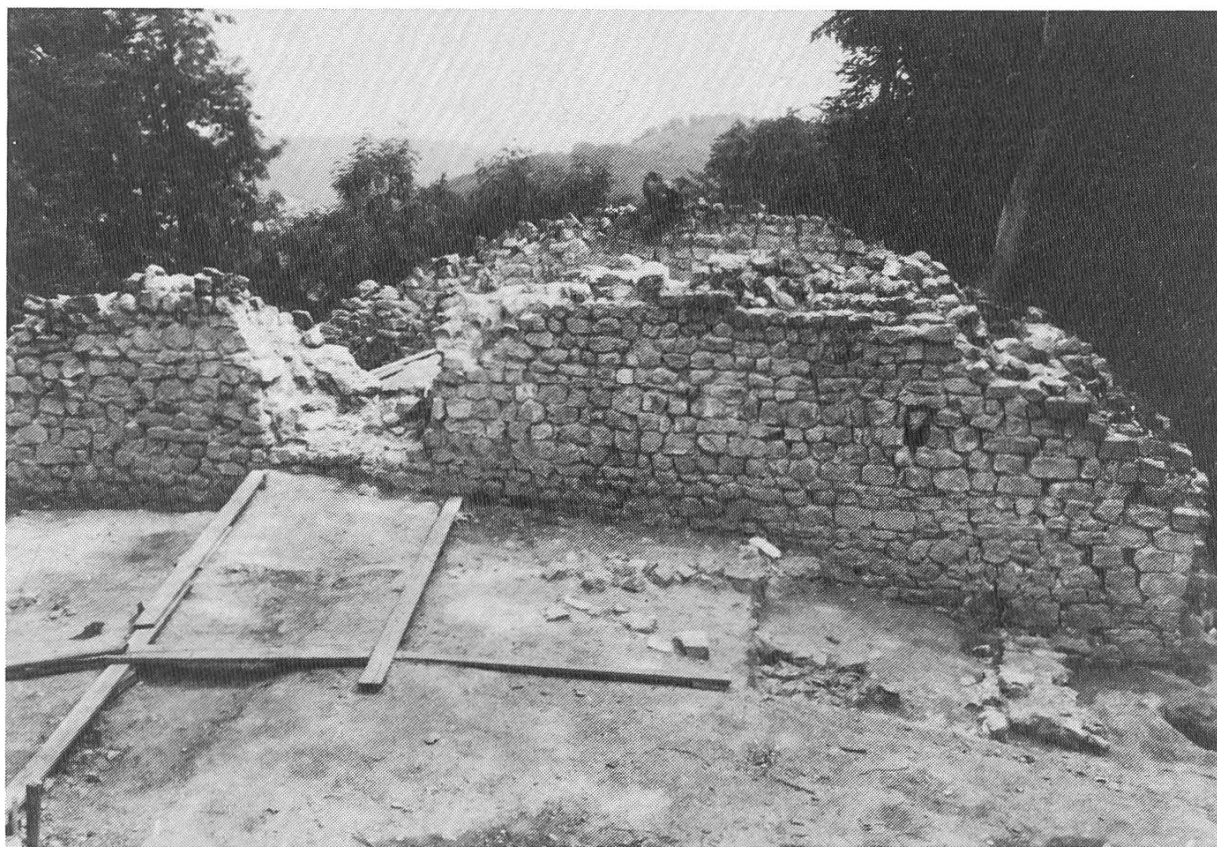
Ruine Altenberg bei Füllinsdorf während der Ausgrabung. Im Raum vor der Quermauer befanden sich Holzbauten.

Füllinsdorf, Altenberg. Die schon länger bekannte Burgruine, die erstmals 1982 durch eine Sondierung nachgewiesen wurde, ist 1986 durch W. Meyer (Hist. Seminar der Universität Basel) und J. Obrecht im Auftrag des Amtes für Museen und Archäologie und in Zusammenarbeit mit der Gemeinde Füllinsdorf vollständig ausgegraben und restauriert worden. Sie bestand aus einem turmartigen Gebäude mit den imposanten Massen von ca. 8x15 Metern, einer Umfassungsmauer sowie Spuren mehrerer Holzbauten. Das Hauptgebäude muss ausgebrannt sein, wurde dann aber