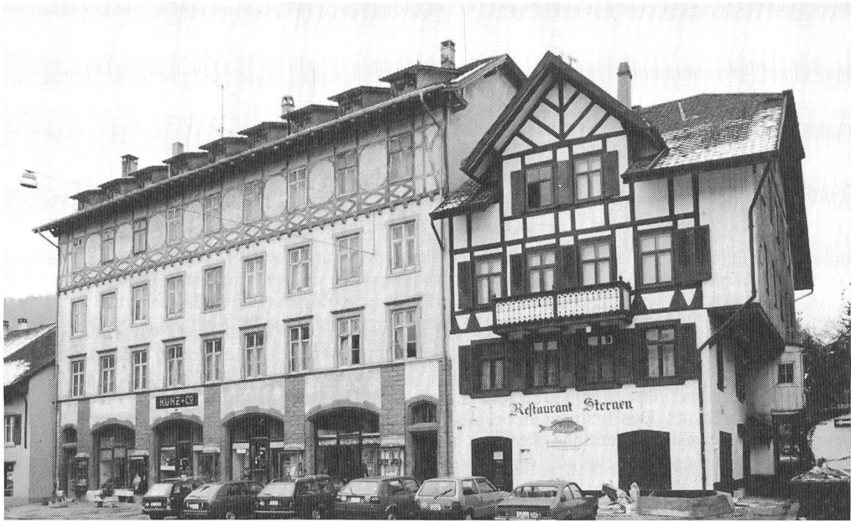
Ausserhalb des alten Sissacher Dorfkerns steht das Kaufhaus Kunz & Co. und das nun unter Denkmalschutz gestellte Restaurant Sternen.

während das Innere 1903 in Jugendstil ausgestattet worden ist. Bei der kürzlichen Innenrenovation wurden Malereien von 1877, Dekorationen und Mobiliar von 1903 vortrefflich instandgestellt. Regierungsratsbeschluss Nr. 2862 vom 2. Dezember 1986.