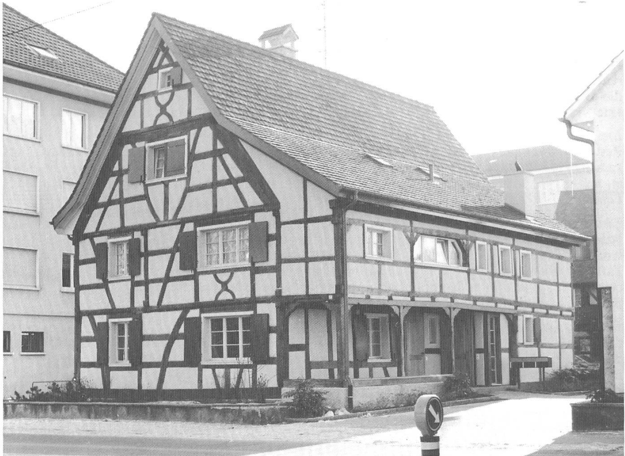
Abb. 3. Fachwerkhaus Baslerstrasse 54 in Allschwil.

Allschwil, Restaurant Elsässerhof, Hegenheimerstrasse 20. Das zweigeschossige, vierachsige Gebäude war ursprünglich ein Bauernhaus und wurde erst später als Restaurant eingerichtet. Mit den nahezu quadratischen Fenstern und dem Krüppelwalmdach dürfte das Haus aus dem ausgehenden 18. Jh. stammen. Das vor kurzem restaurierte traufseitige Fachwerkhaus ergänzt vortrefflich den alten Dorfkern an der Hegenheimerstrasse. Regierungsratsbeschluss Nr. 1455 vom 9. Juni 1987.