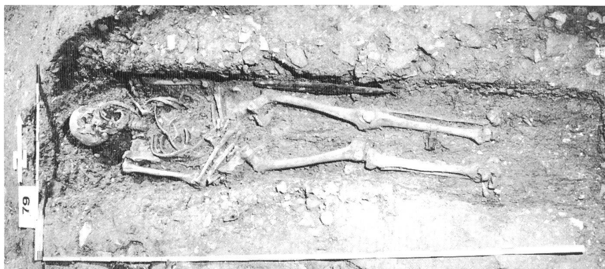
Abb. 2. Grab in einer Ecke des Kirchenschiffes mit männlichem Skelett ohne Beigaben, Länge 180 cm.