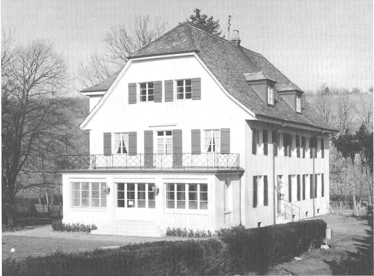
Abb. 4. Schössli Benken nach der Restaurierung 1987.

Biel-Benken, Schössli, Mühlegasse 25. (Abb. 4) Das sogenannte Schössli Benken liegt am Westende des Dorfes direkt an der Landesgrenze. Es ist umgeben von einem grossen Garten und von Wiesland oberhalb des Birsigs. Nach seinem Standort ist es wohl identisch mit dem Lehen- oder Pächterhaus des ehemaligen Weiherschlosses. 1520 wird es als Holzhaus erwähnt, 1754 besass es bereits die heutige Form als zweigeschossiges Gebäude mit Krüppelwalmdach und erhöhtem Eingang über einer mehrstufigen Treppe. Im 19. Jh. wurde es als Landsitz ausgebaut. Nach mehrmaligem Besitzerwechsel diente das Schössli mehrere Jahre als Kinderheim der Diakonissenanstalt Riehen. Vor kurzer Zeit erwarb es die Gemeinde Biel-Benken und richtete darin ein Begegnungszentrum ein. Durch eine gelungene Renovation wurde die äussere Gestaltung des Schösslis weitgehend verbessert, so dass es sich gut in die parkähnliche Umgebung einfügt. Regierungsratsbeschluss Nr. 1162 vom 5. Mai 1987.