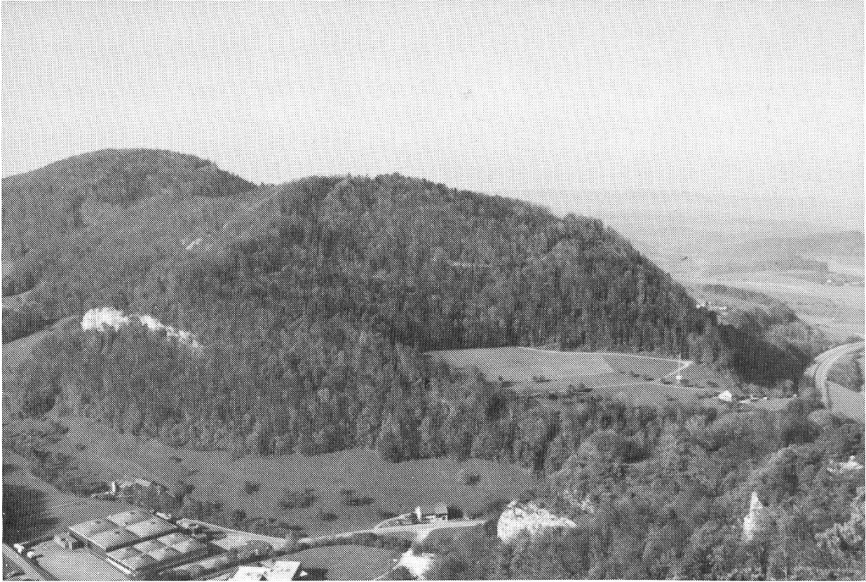
Abb. 1. Der Rängen von Südosten. Blick von der Burgstelle Schanz (Wild-Eptingen, ältere Burg) auf dem Eichenberg bei Eptingen auf die Bergterrasse Oberburg und die Riedflue. Foto von Peter Stöcklin (Nov. 1988).