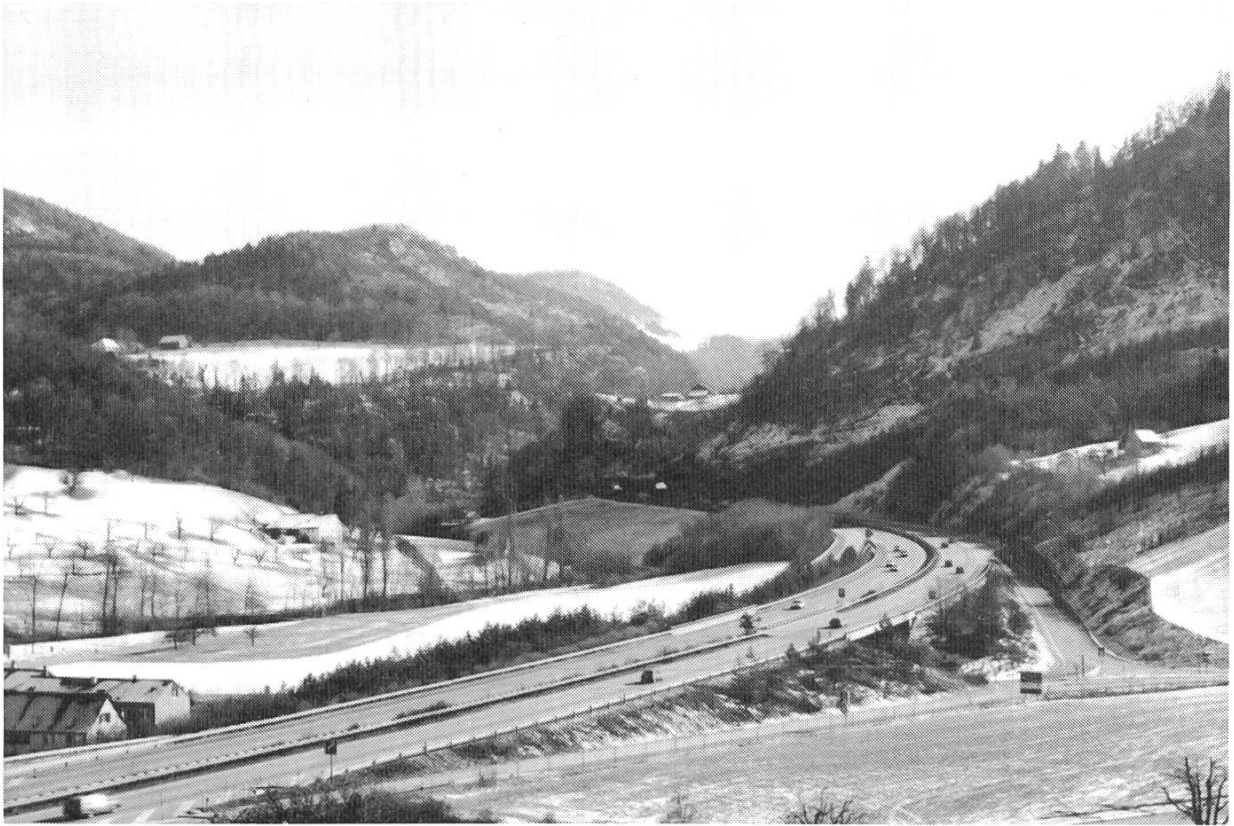
Abb. 4. Das Diegtertal oberhalb von Ober-Diegten talaufwärts gesehen. In der Bildmitte die ins Tal hineinragende Bergterrasse Oberburg mit dem gleichnamigen Hof. Sie ist von den beiden Röhren des Oberburgtunnels durchbohrt. Rechts der beim Autobahnbau 1967 abgerutschte Hang des Ränggen. Auf der linken Bildseite: unten der Einzelhof Rütiweid, oben die Rodung Witwald mit dem Herrschaftsgebäude. Dahinter der Eichenberg, auf dessen Kuppe sich die Burgstelle Schanz befindet. Foto Peter Stöcklin (Febr. 1989).

sen, aus welcher Zeit sie stammte. Handelte es sich etwa um die Überreste des vermuteten Gehöfts aus der Zeit der Burg oder einer älteren Siedlung?