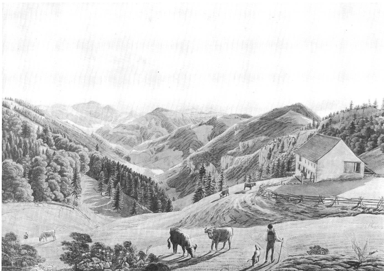
Abb. 1. Jakob Christoph Bischoff: Ansicht des Vogelbergs gegen das Bogental, Aquarell, 47x67 cm, 1813

Da das Baselbiet nie zu den für den Tourismus attraktiven Regionen der Schweiz zählte, ist die Zahl der seit dem 18. Jahrhundert beliebten «Ansichten» – zumeist kolorierte Kupferstiche – von vornherein viel geringer als dies für die klassischen Reisegebiete gilt. Die meisten jener druckgraphischen Blätter, welche in Reisebeschreibungen oder Mappenwerken ein Motiv aus dem Gebiet des heutigen Kantons Basellandschaft zeigen, sind in der Sammlung vorhanden. Hier gibt es nur noch wenig zu ergänzen.