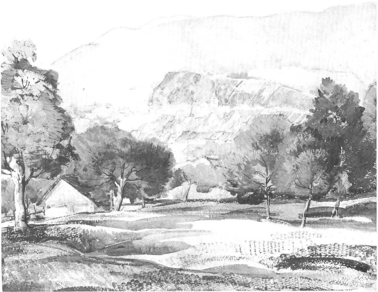
Abb. 4. Wilhelm Balmer: Blick auf Liestal, Aquarell, 44x55 cm, undatiert

Von Baselbieter Künstlern jener Zeit gelangten u. a. folgende Arbeiten in die Sammlung: