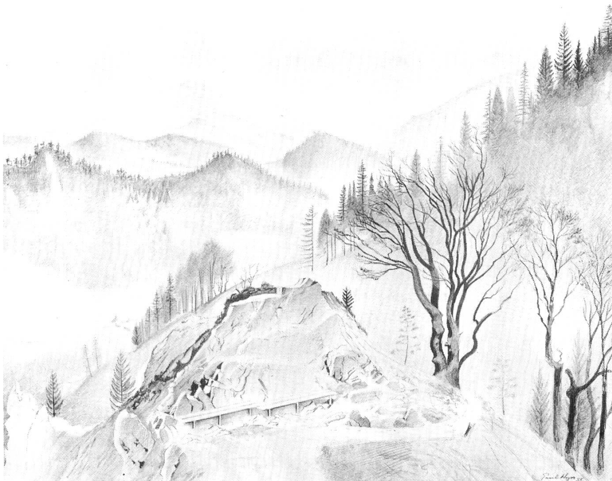
Abb. 2. Paul Wyss: Auf dem Belchengipfel, Farbstiftzeichnung, 54x66 cm, 1935

In diese Rubrik gehören folgende Neuerwerbungen: