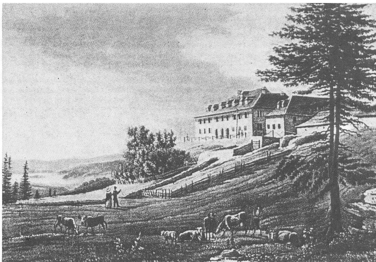
Abb. 2. Wirtshaus auf dem Weissenstein um 1840. Nach einer Aquatinta von Joh. Jak. Meyer, Zürich

plötzlichen Wendung des Weges mit dem Freudenruf zu begrüßen: «Dort sind Häuser, wir sind oben!» Im schönsten Abendlicht sahen wir bald die Hinterfassade der Weissensteinhäuser , eilten ermutigt die Weide bis zur Stosshütte hinab und die letzte ansteigende Partie unseres Weges, die Hausmatte hinauf. Schlag 7 Uhr nach unserer Zeitrechnung waren wir oben, von den hier anwesenden Familien Staehelin-Merian, Staehelin-Burckhardt und von meinem Siegrist Bulacher und seinen Kindern freundlich begrüßt und bewillkommt.