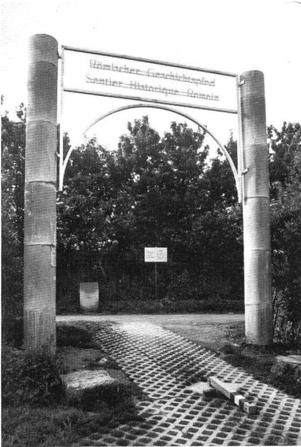
Eingangportal des neuen «Römischen Geschichtspfads» in Augusta Raurica.