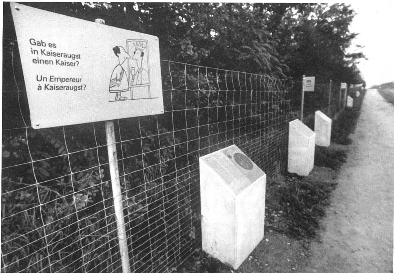
2000 Jahre Geschichte verkürzt auf 250 m: Der neue «Römische Geschichtspfad» in Augusta Raurica.