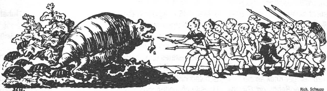
Feinde ohne Ende

Im Baselbieter Landrat hielt der Präsident Walter Degen eine kurze Rede. Er dankte der «göttlichen Vorsehung», den Soldaten im Aktivdienst und den Frauen im Zivilleben für ihren Beitrag zur Bewahrung vor dem Krieg. Davon, dass es die Alliierten gewesen waren, die Europa - und die Schweiz - von der nationalsozialistischen Diktatur befreit hatten, sprach er ebensowenig wie dies Bundespräsident Eduard von Steiger in seiner Rede getan hatte. 5 Zur Feier des Tages begab sich der Rat dann am Nachmittag in corpore auf die Sissacher Fluh. 6 Zuvor war aber noch von den Präsidenten aller Fraktionen eine ge-