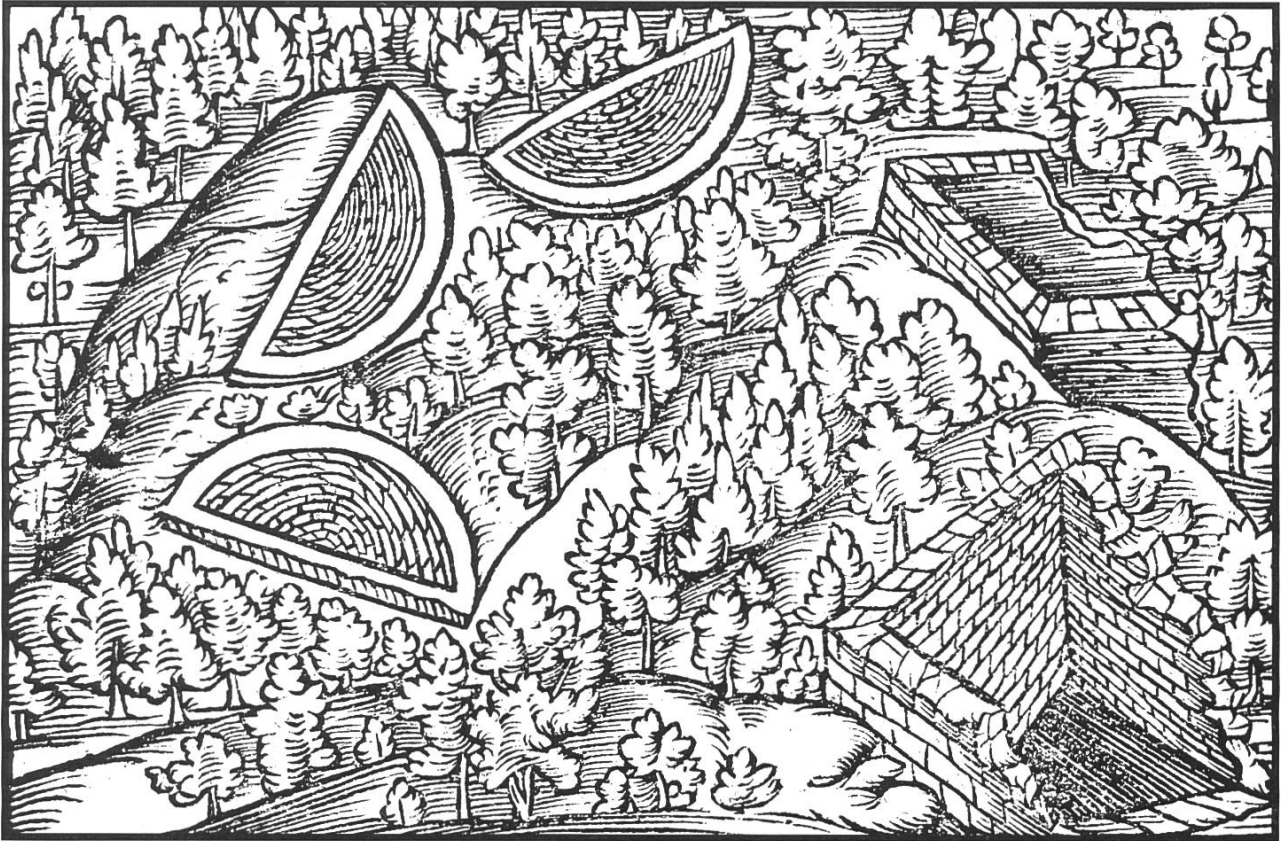
Darstellung der bewaldeten Theaterruine in der «Stumpfschen Chronik» von 1548. Erkennbar sind die charakteristischen Entlastungsbögen der sogenannten «Neuen Thürme».

schädigung drohte den Augster Ruinen indessen nicht nur von den Kastell-Erbauern und den schatzgrabenden Maulwürfen, sondern auch von den Bauern.