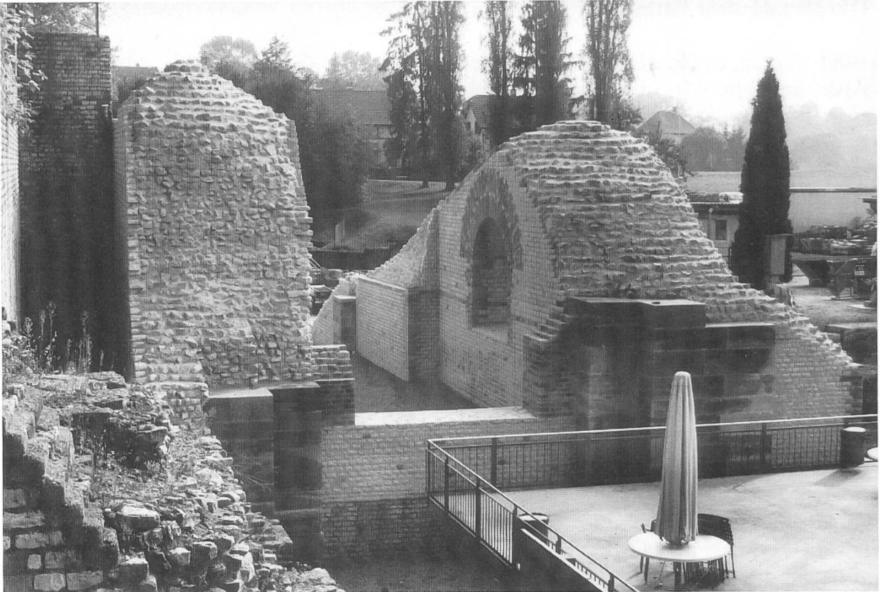
Blick von Norden in den neu restaurierten Nordaditus. Deutlich erkennbar ist das System von vor- und zurückspringenden Grundpfeilern aus Buntsandstein. Im Zentrum ist die aus statischen Gründen erfolgte Rekonstruktion des Fensterbogens sichtbar.

für das Publikum gesperrt werden. Höchste Alarmstufe war gegeben!