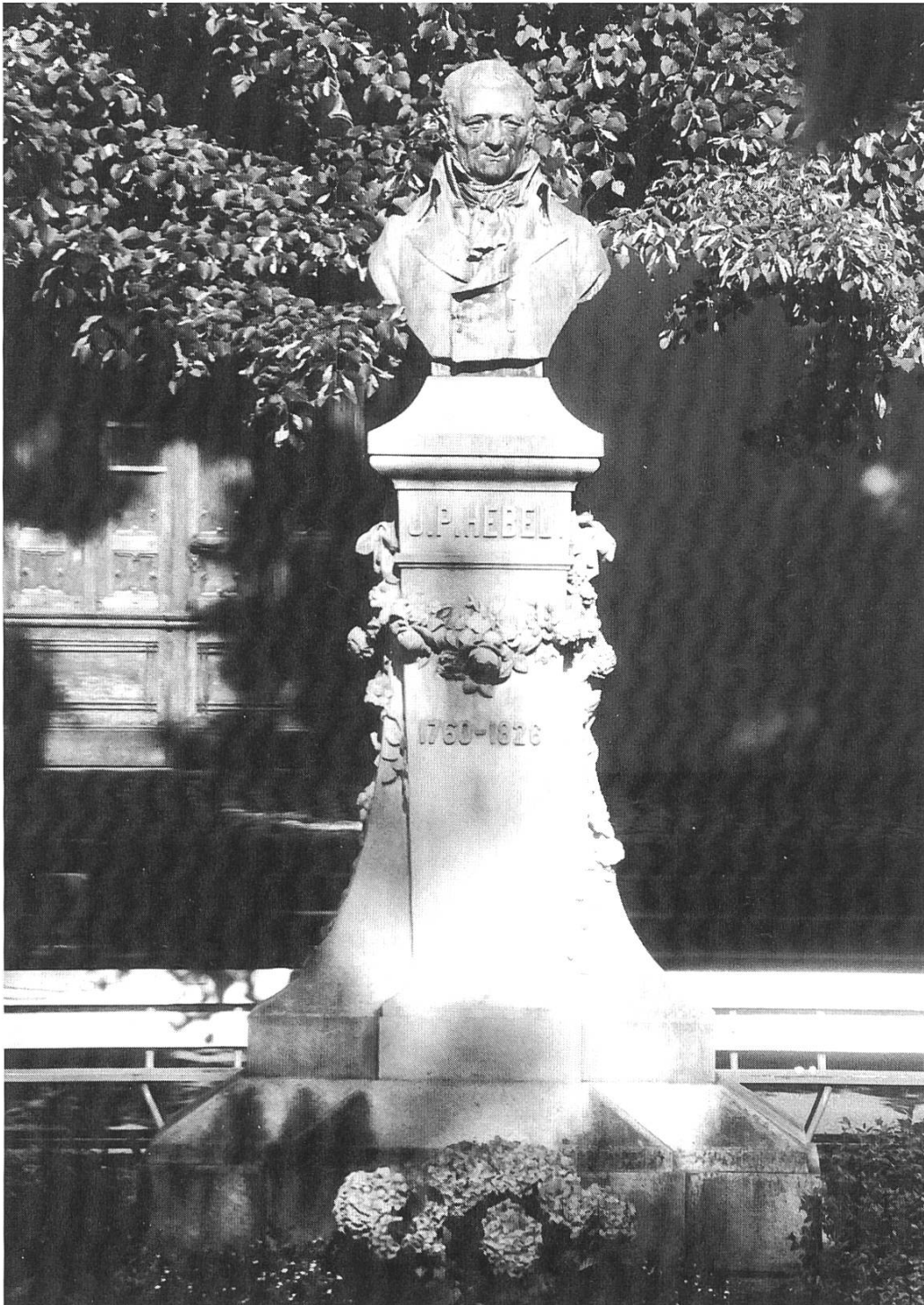
Das Hebel-Denkmal vor der Peterskirche

«Eine tiefe Bewegung», so meldet der Berichterstatter weiter, «war durch die festliche Menge gegangen, als die Hülle fiel, die weisse Leinwand in Falten niederrauschte und das Denkmal ins Licht der Sonne tauchte.»