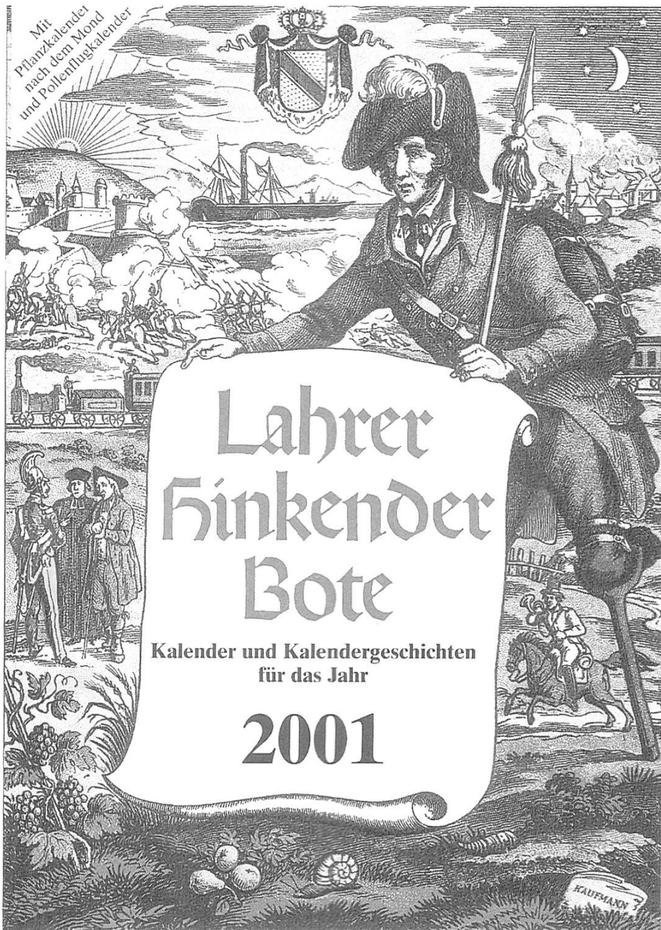
Der älteste Kalender Deutschlands erscheint im Verlag Ernst Kaufmann.

älteste der Almanache der Region Nordwestschweiz-Südbaden-Elsass, der Lahrer Hinkende Bote, erschien in diesem Jahr erstmals beim Verlag Ernst Kaufmann im mittelbadischen Lahr. Der traditionsreiche Kalender blickt auf eine eigentliche Erfolgsgeschichte zurück. Schon dreizehn Jahre, nachdem der Buchdrucker und Verleger Johann Heinrich Geiger den ersten «hinkenden Bott»