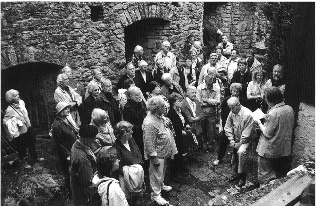
Interessierte Exkursionsteilnehmer auf Saugern.

Das 55 m lange und bis 17 m breite Schloss mit einer im Norden senkrechten Felswand fiel im Jahre 1499 im Schwabenkrieg teilweise den Flammen zum Opfer. Und so blieb es bis 1789 als Ruine im Besitz des Bistums Basel. Während der Französischen Revolution (1793)