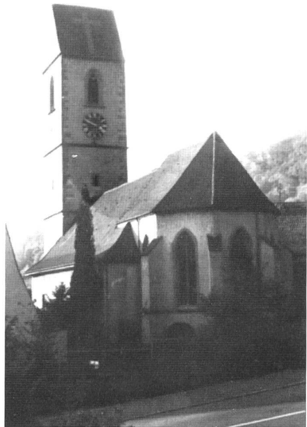
Grenzach-Wyhlen, Ortsteil Grenzach, Pfarrkirche St. Leodegar (Repro aus: J. Helm, Kirchen und Kapellen im Markgräflerland, 1989, S.108).

Burgund) vom Jahre 858 eine villa Sisiacum genannt wird, so bezieht sich diese gar nicht auf unsere Gegend; es ist nicht, wie Bruckner meint, Sissach darunter zu verstehen.»