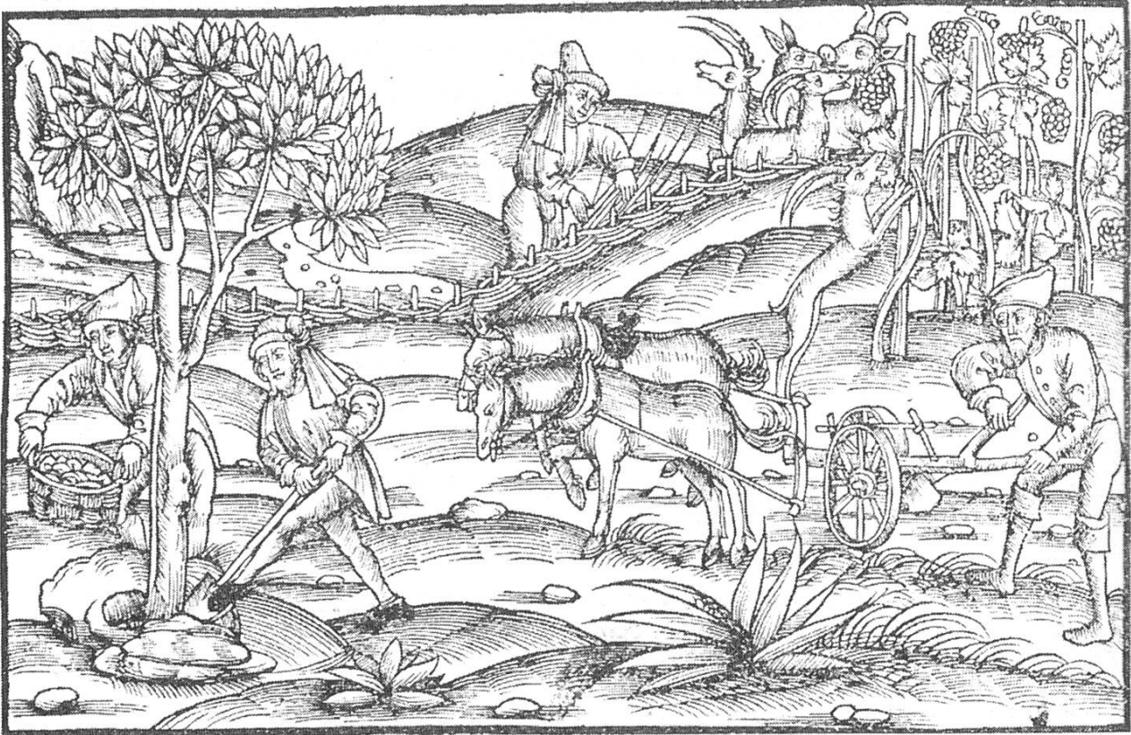
Gartenbau und Feldwirtschaft in der Zeit der Dreifelderwirtschaft. 5

die das mittelalterliche Dorf und damit auch den Dorffetter zum Thema haben und uns Einblick in das spätmittelalterlich-frühneuzeitliche Leben zur Zeit der Dreifelderwirtschaft 7 geben.