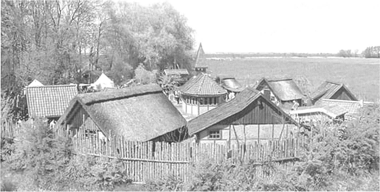
Drachen-Luftbild des mittelalterlichen Dorfes.

Universität Ulm, das sich mit seltenen Ackerkräutern zur Zeit der Dreifelderwirtschaft befasst. 9