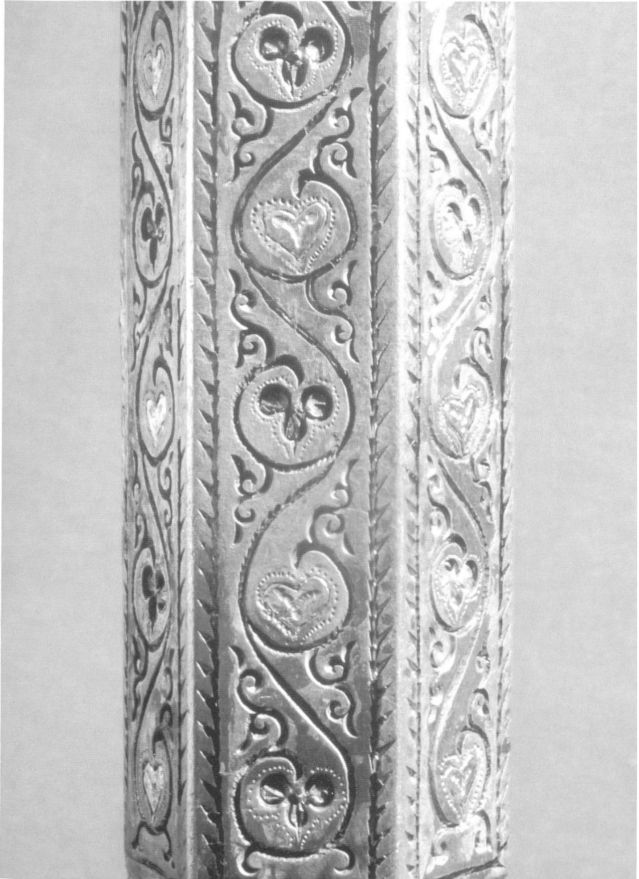
Teil eines Kandelabers, wie er bei Banketten zur Beleuchtung verwendet wurde. Teilweise vergoldet und nielloverziert.