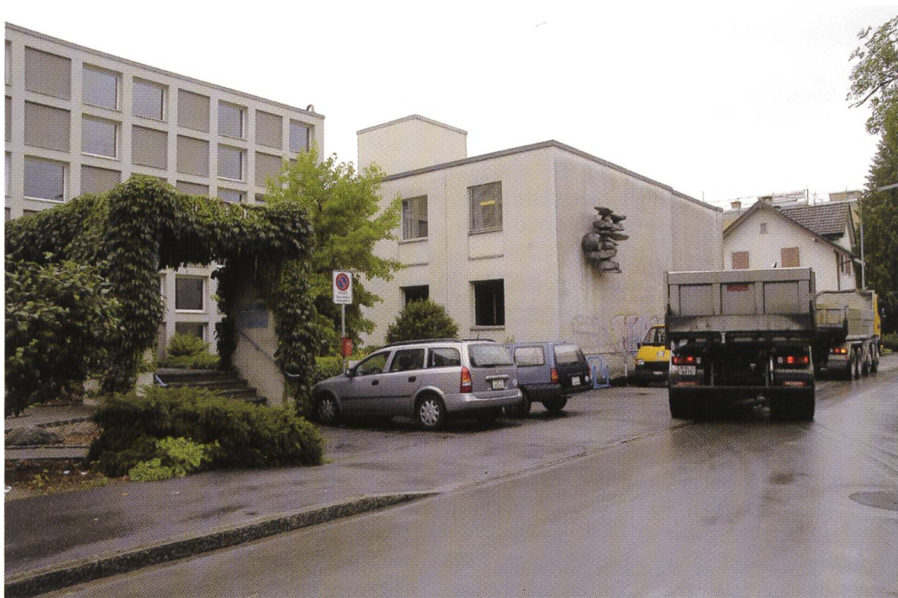
Ursprünglich für eine Doppelnutzung gebaut: Staatsarchiv und Schul- und Büromaterialverwaltung an der Wiedenhubstrasse 35 in Liestal.

Das Archiv war lange Zeit zum grössten Teil im Regierungsgebäude, aber auch in anderen Lokalitäten untergebracht. Alle Räumlichkeiten waren suboptimal und improvisiert. Im Amtsbericht der Landeskanzlei von 1923 heisst es zum Beispiel: Die neu installierte Zentralheizung ermöglicht nun auch den Aufenthalt und die Arbeit in den Archivräumen während der kälteren Jahreszeit. 1947 liest man: Der Archivbesuch durch Drittpersonen war wiederum ein ziemlich re-