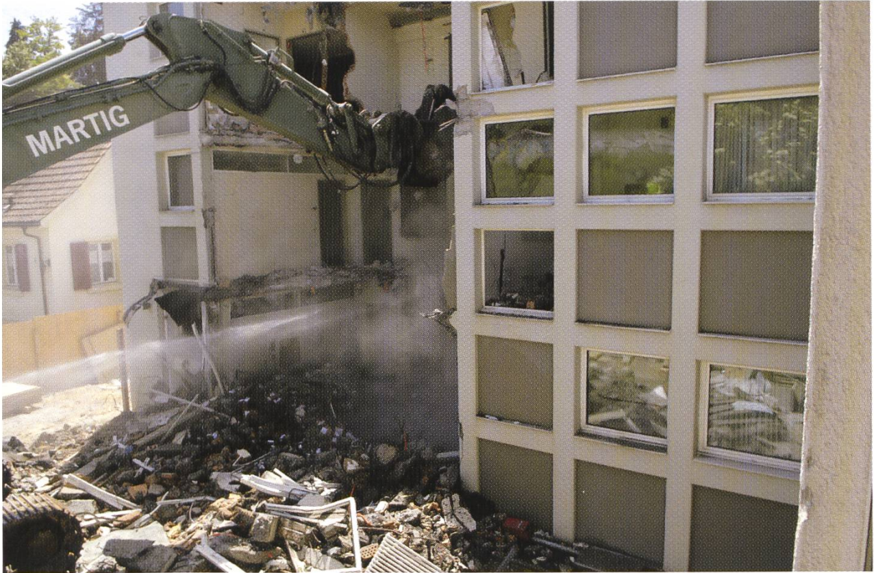
Abbrucharbeiten am Bürotrakt im Sommer 2006.