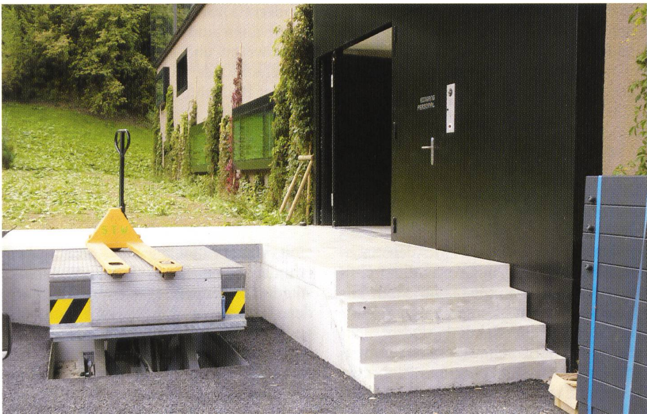
Die neue Rampe für grössere Aktenanlieferungen.