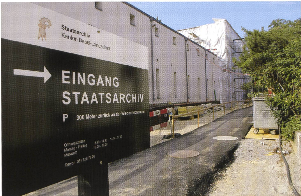
Trotz Bauarbeiten läuft der Betrieb weiter: der provisorische Zugang.