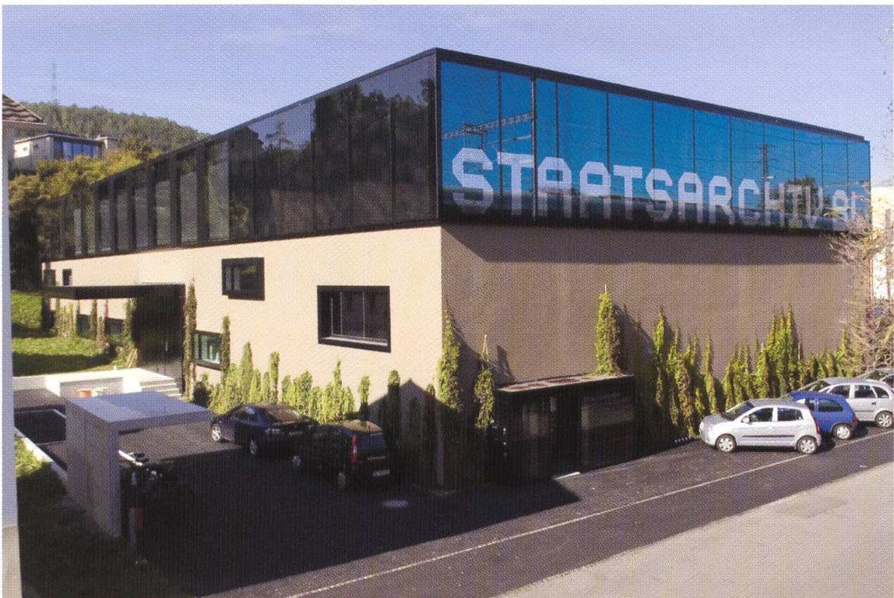
Das neue Staatsarchiv im Sommer 2007 ist bezogen und eingeweiht.

In den 80er Jahren spitzte sich die Platznot so sehr zu, dass man beschloss, die Magazine zu unterkellern. Schon bei der Fertigstellung 1992 war klar, dass die Probleme mit dieser teuren Massnahme noch lange nicht gelöst waren. Der Aktenrückstau, der in den Dienststellen entstanden war, konnte nur ungenügend aufgelöst werden. Immer problematischer wurden auch die Arbeitsräume für das Personal und die Besucher. Die Sicherheit der Akten war oft nicht gewährleistet, weil es die Betriebsabläufe nicht erlaubten.