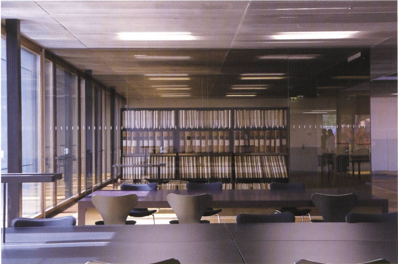
Der grosszügige Lesesaal bietet auch Raum für zahlreiche Gruppenarbeitsplätze.