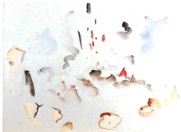
Stromboli, 1923 Aquarell auf Papier auf Karton aufgezogen Nicht signiert