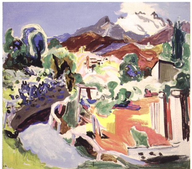
Tessiner Landschaft (Öl auf Leinwand)

ser Bilder zeigt er ein gesundes, starkes rhythmisches Gefühl.» Diese Beurteilung durch den damals anerkannten Kunstkritiker zeigt auf, wie eine vielversprechende Laufbahn durch den frühen Tod unterbrochen wurde.