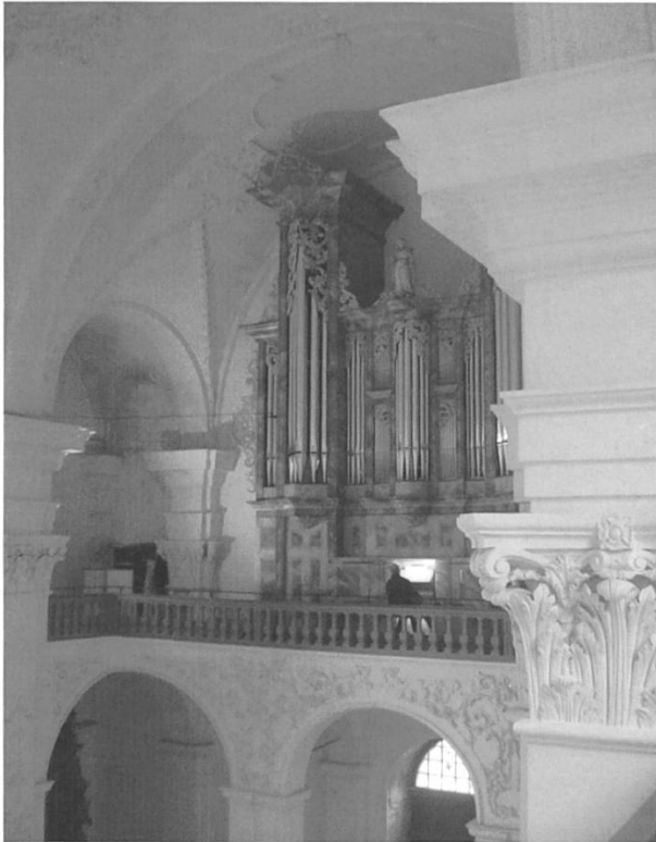
Bild 7: Bellelay, die rekonstruierte Bossart-Orgel aus dem frühen 18. Jh. (Foto: Dominik Wunderlin).

über Sornetan ganz bewusst als besonders reizvollen Wegabschnitt eingebaut. Zum einen gibt es hier viele historische Bezüge in den Raum Bielersee 44 , zum andern wissen wir aus der Pilgerforschung, dass auch der mittelalterliche Pilger nicht immer den direkten Weg zum Ziel gewählt hatte. Ausserdem kann mit diesem etwas längeren Weg über das an einem Hochmoor gelegene Bellelay auch die – abgesehen von den Gorges de Court – wenig attraktive Talstrecke im oberen Birstal umgangen werden.