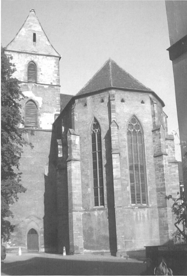
Bild 4: Basel, St. Alban Kirche, einst eine Klosterkirche der Cluniazenser.

führung über die malerischen Kleinstädte La Neuveville, Le Landeron und Erlach, vorbei an der ehemaligen Benediktinerabtei St. Johannsen und durch Vinelz mit den spannenden Fresken in der Dorfkirche (u. a. Abrahams Schoss und Christophorus).