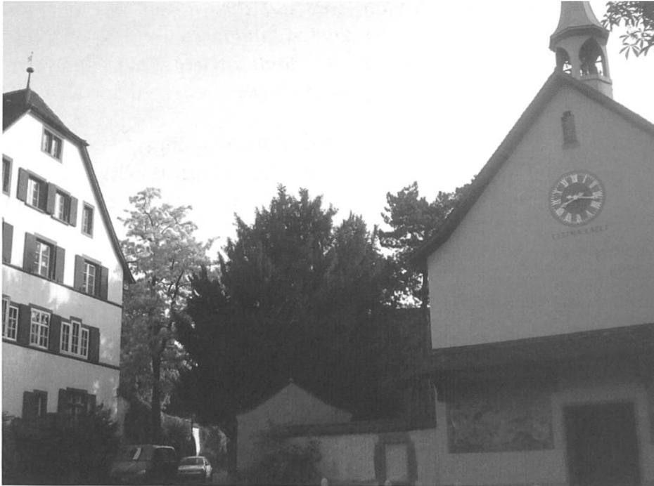
Bild 6: Basel, St. Jakobskirche mit Siechenhaus.

ein toter Hund oder ein totes Ross –, es ist egal, wer darin ruht. Es gibt mehr als 250 Belege in Luthers Schriften, wo der Reformator gegen den Jakobskult zürnt. Er verstieg sich sogar zur Alternative «aut Christus, aut Jakobus».