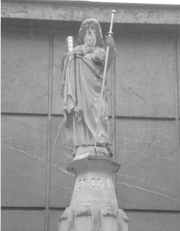
Bild 1: Basel, Jakobsbrunnen an der Hermann Kinkelin-Strasse (urspr. Standort: Aeschenvorstadt/Brunngasse), 1453.