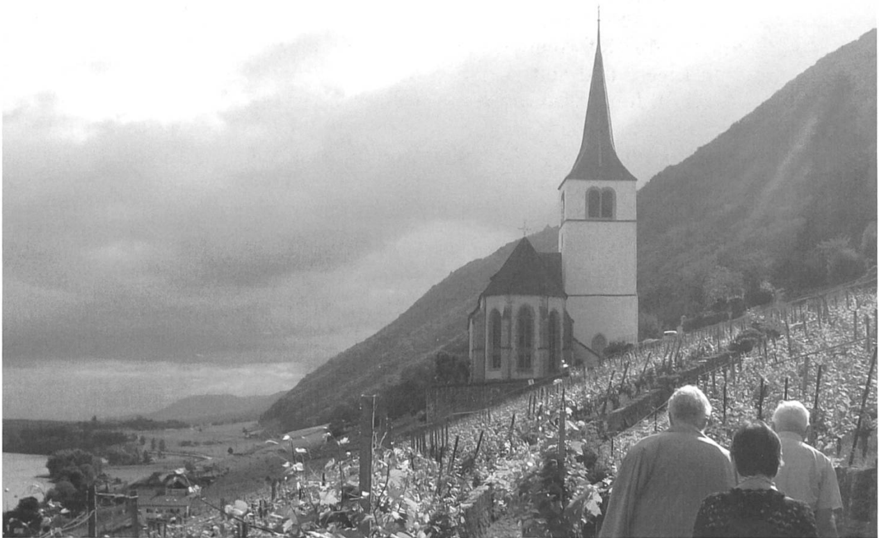
Bild 2: Die spätmittelalterliche Kirche von Ligerz liegt direkt am alten Pilgerweg.

Rebberg werde bereits 1261 erwähnt, weiss jedenfalls Annemarie Dubler zu berichten. 8 Es ist also gut möglich, dass an diesem schön gelegenen Ort, den heute manche als Kraftort bezeichnen, 9 schon in jener fernen Vergangenheit Menschen Kraft geschöpft hatten, ja, dass sich dort sogar Wunder zugetragen hatten. Es gibt noch ein weiteres Indiz, dass bereits vor 1417, als in den Akten von der Bewilligung zum Bau einer Kapelle berichtet wird, bereits ein Bethäuschen existiert hat: 1404 werden nämlich 14 Zinse der Heiligkreuzkapelle genannt: «levriera super viam eis pellerin in qua itur apud Chavannes». Der Pilgerweg wird hier notabene erneut namentlich ge-