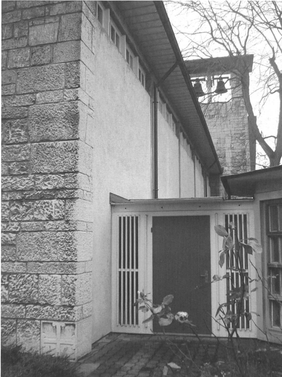
Abb. 3: Der Eckstein (vorne links), unweit des kurzen Verbindungsgangs zur oktogonalen Taufkapelle.

Heute allerdings, wo das Interesse am Altgriechischen (auch an den Schulen) leider kaum mehr vorhanden ist, steht die schöne Inschrift etwas verwaist da. Es ist aber sehr zu hoffen, dass kommende Generationen sich an das Gelöbnis im Jahre 1939 und an den Bau der Kirche mitsamt ihrer alten Inschrift erinnern werden.