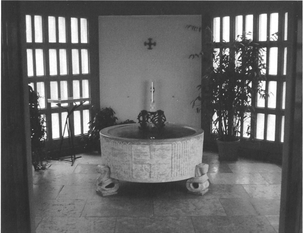
Abb. 6: Das ebenfalls von Albert Schilling geschaffene Taufbecken in der oktogonalen Taufkapelle.

Die zweite Hälfte der Inschrift (und damit das Ende des ganzen zitierten Satzes) bildet der Genetivus absolutus ontos akrogoniaiou liquou autou Cristou Ihsou («Euer Eckstein aber ist Jesus Christus selbst»). An stark betonter Stelle steht der Name Christi, eigens noch hervorgehoben mit autou («selbst»). Durch die Wortstellung und indirekt durch die ganze Satzmelodie hervorgehoben ist das Partizip ontos («seiend»), welches durch die Voranstellung adversative Kraft und Bedeutung gewinnt. Der Sinn des so modifizierten Teilsatzes ist dann: «Die Apostel und Propheten sind eure Grundlagen «ihr steht gewissermassen auf ihren Schultern» ; Eckstein jedoch «also der tragende Teil des ganzen Baues» ist Christus selbst.» (Die