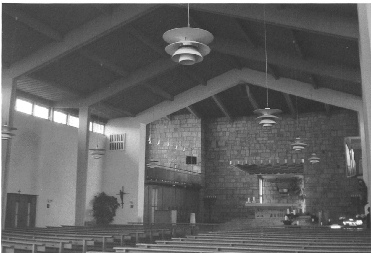
Abb. 2: Der lichtdurchflutete Innenraum von St. Michael; Blick gegen den Altarraum.