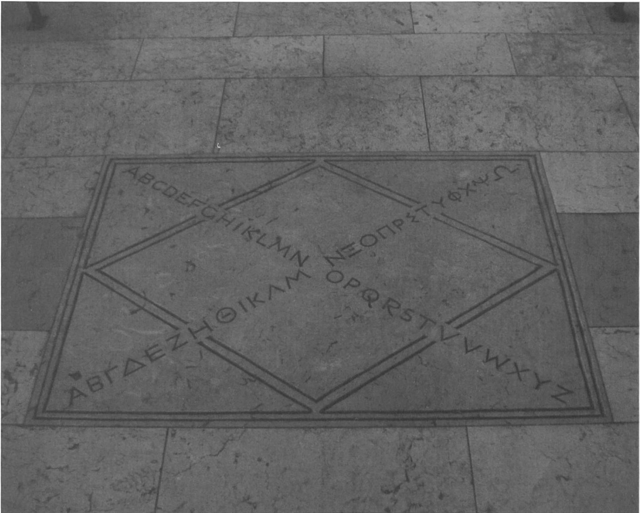
Abb. 9: Detailaufnahme der Steinplatte in der Michaelskirche.

22) direkt herstellt, indem sie den Psalm zitiert: