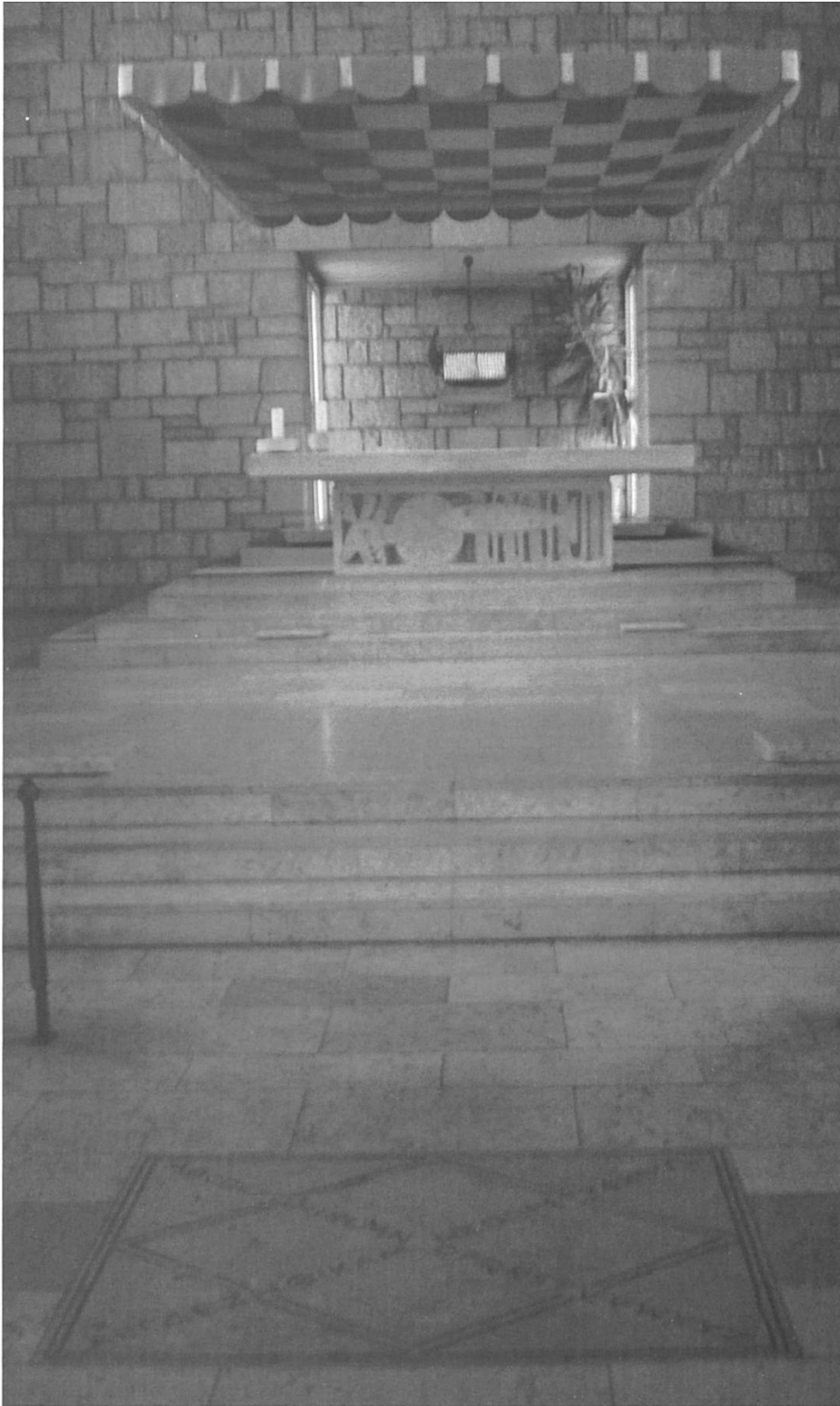
Abb. 8: Kurz vor den drei Altarstufen findet sich eine in den Boden eingelassene Steinplatte, bei der sich das lateinische und das griechische Alphabet kreuzen.