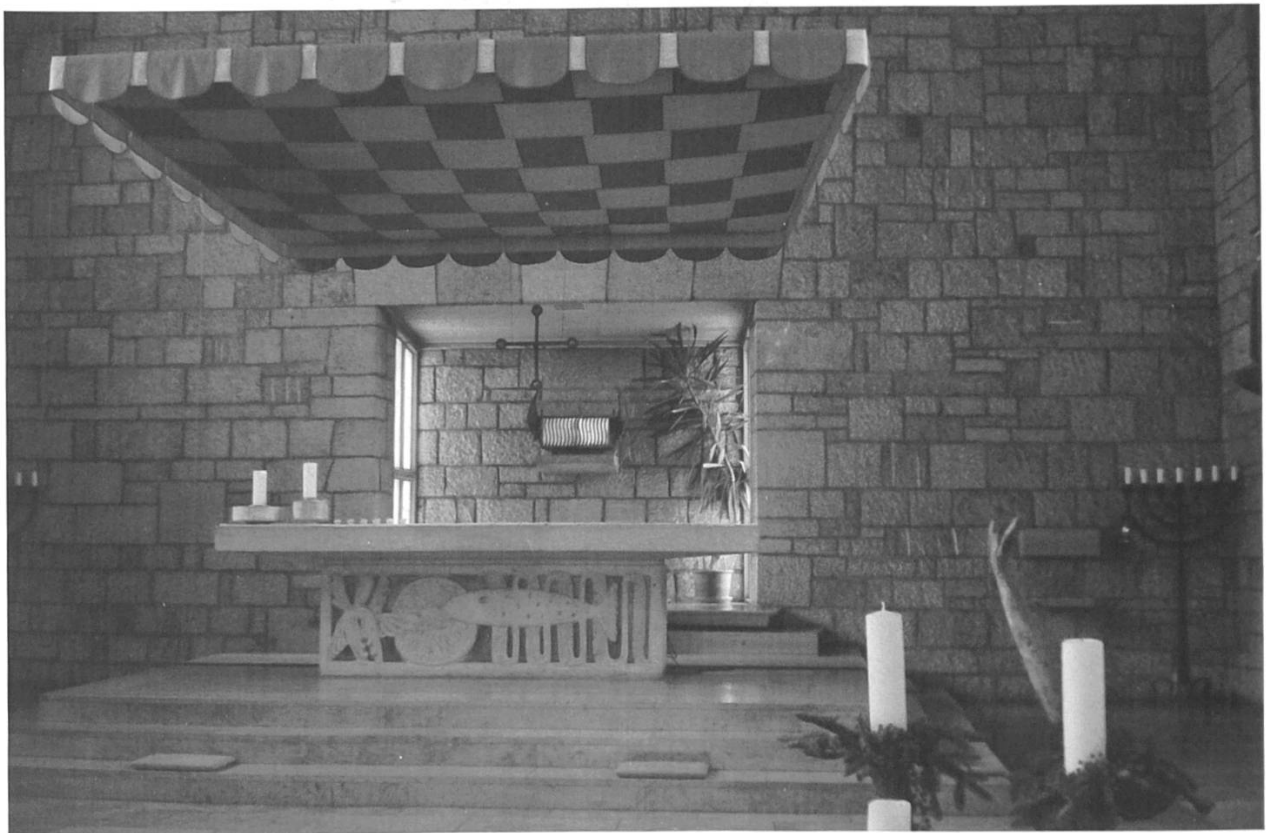
Abb. 5: Der Hauptaltar der Michaelskirche, ein Werk des Bildhauers Albert Schilling.