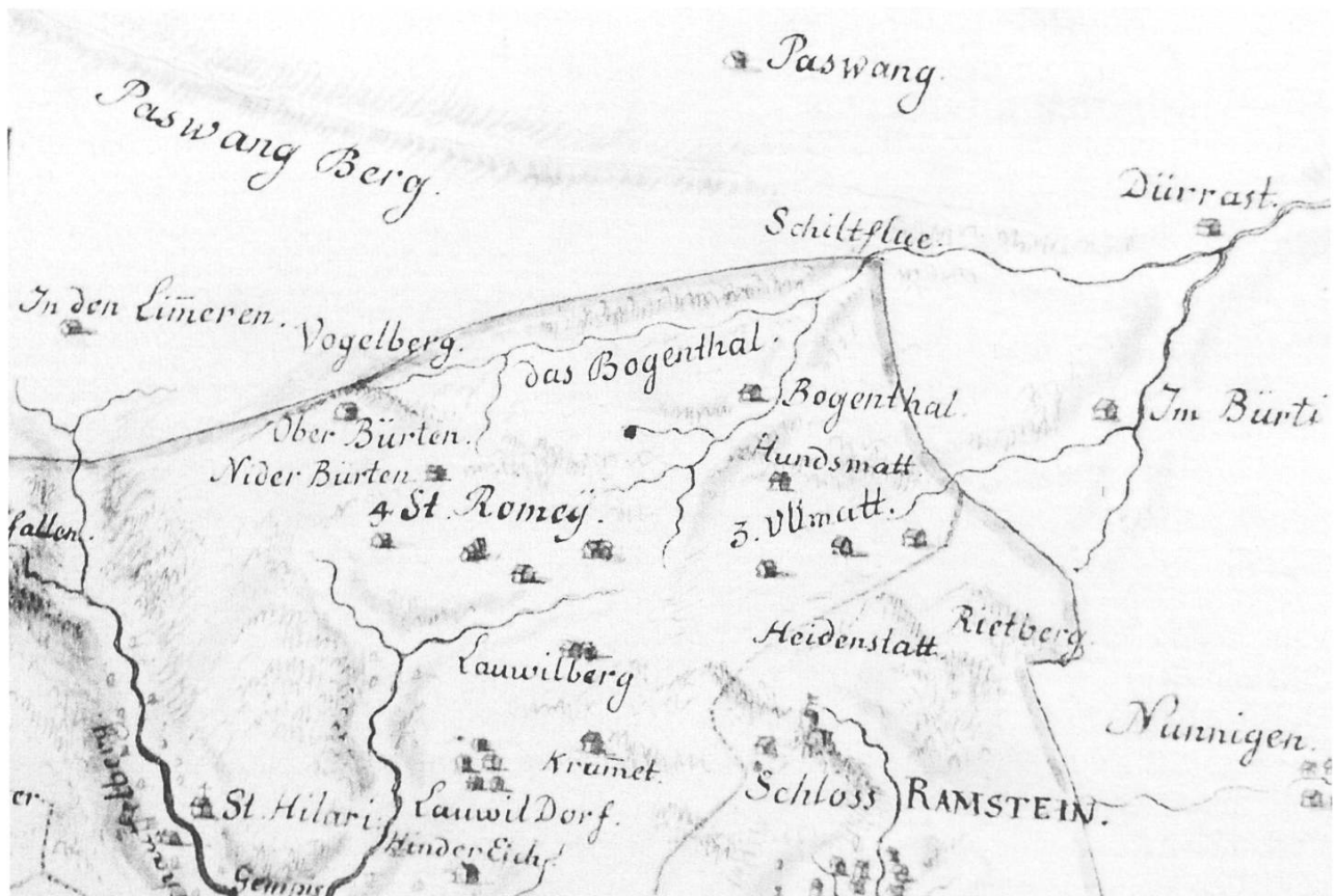
Abb. 2: Das Bogenthal in der Karte «Ammt Waldenburg» (um 1755, StABS, Falk D22)