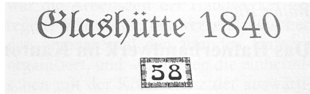
Abb. 6: Türinschrift an der ehemaligen Glashütte Waldenstein im Gemeindegebiet von Beinwil SO, am westlichen Eingang ins Bogental

Im Jahr 1840 erwarb die Familie Gresly zudem die in der Gemeinde Rebeuve-lieu JU gelegene Glashütte «de Roches», um ähnlich zu Guldental-Bärschwil eine wechselnde Produktion zwischen Waldenstein und Roches durchführen zu können. Ab 1850 geriet die Familie Gresly mit ihren Glashütten zunehmend in unternehmerische Schwierigkeiten. Trotz verschiedenen Rettungsversuchen mussten ihre vier Hütten um 1853 liquidiert werden. So kam auch die beim Waldenstein gelegene, zweite Glashütte im Bogental nur auf eine Produktionsperiode von etwas über zehn Jahren.