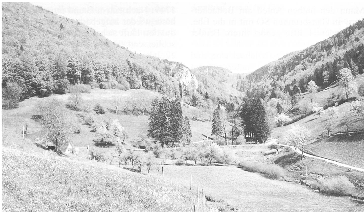
Abb. 1: Das Bogental von Westen: In der Bildmitte umschliesst ein Weg den Weier (Aufnahme vom 22. April 2011)