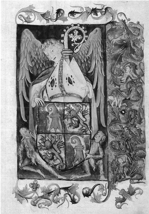
Frontispiz-Miniatur im Lehen-Buch, 1441 (AAEB, Cod. 298A)

Notarielle Protokolle und Originalurkunden (Testamente, Kaufverträge, Schuldverschreibungen ...) aus dem Ancien Régime und der französischen Zeit.