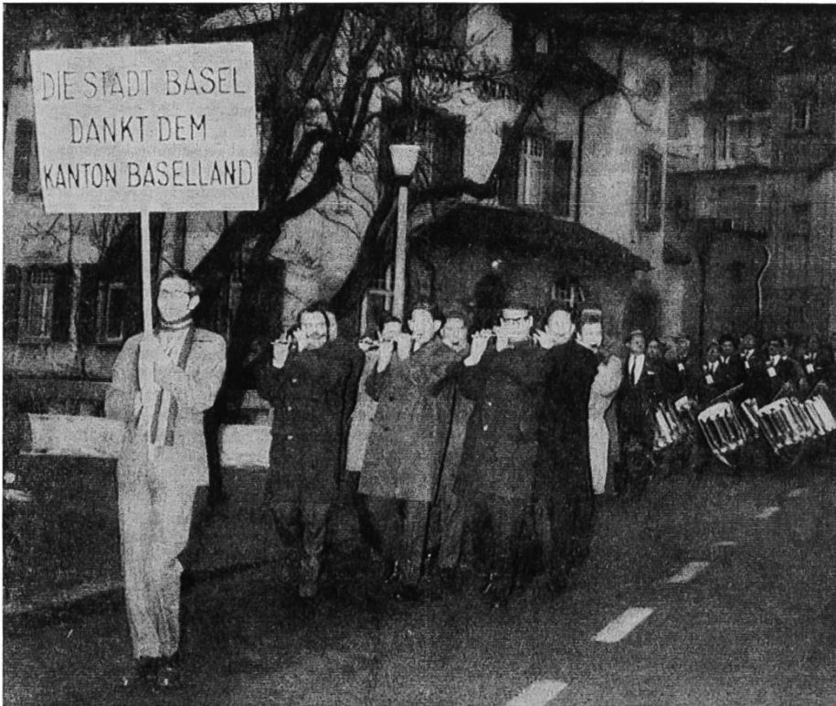
Mit Trommeln und Pfeifen geht es zur Gewerbeschule.

Maschine wurde, da sich offenbar an zentraler Lage Liestals kein geeigneter Platz fand, im Foyer der Gewerbeschule Basel-land (heute: GIBL) aufgestellt. Wie sich der Verfasser erinnert, liessen es sich viele Baselbieter Freunde moderner Kunst nicht nehmen, die zu gewissen Zeiten in Betrieb gesetzte Maschine mit eigenen Augen zu sehen und auch das Quietschen und Rasseln akustisch aufzunehmen.