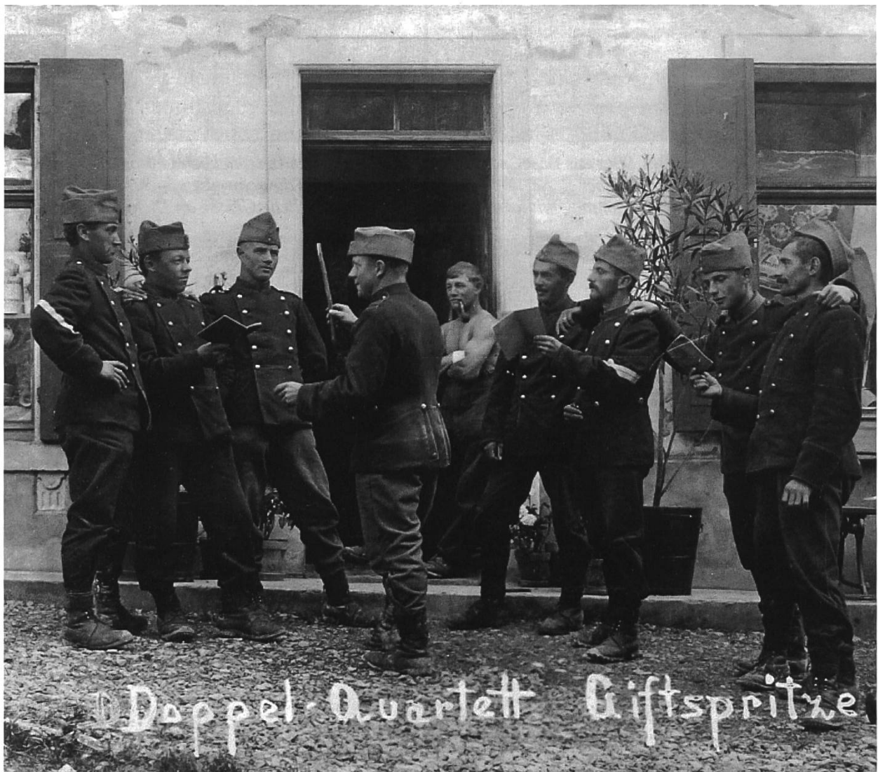
Abb. 5: Der Appenzeller Mitrailleur Tobler schreibt seinem Bruder: «Reigoldswil, den 26. Juli [1915?] L. Br.! Unser Sängerverein. Näheres mündlich.

Reigoldswil nicht mehr vorhanden, denn die Zeitzeugen leben nicht mehr und vor allem hat sich 25 Jahre später der Aktivdienst während des Zweiten Weltkrieges viel stärker ins kollektive Gedächtnis eingepägt. Eventuelle bauliche Denkmäler der damaligen Truppen müssten wir anhand der jeweiligen Einsatzbefehle versuchen festzustellen und zu dokumentieren. Einige der alten Waldwege um Reigoldswil wurden vielleicht von Zürcher Sappeuren gebaut und der eingesunkene Erdbunker oberhalb des Hofguts Bütschen diente vielleicht den Appenzeller Mitrailleuren.