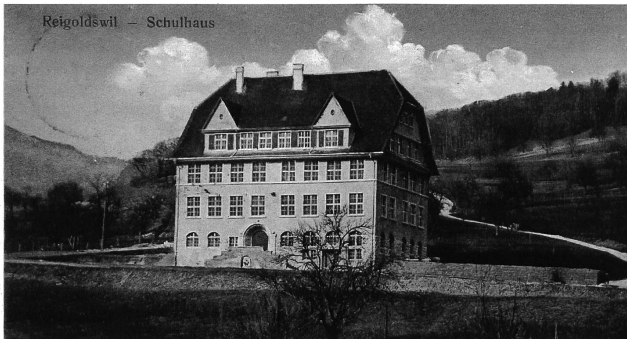
Abb. 2: Karte eines Zürcher Sappeurs: «Halten uns gegenwärtig in Reigoldswil (Baselland) auf. Hier eine Ansicht von unserem Kantonement frdl. Grüsse».