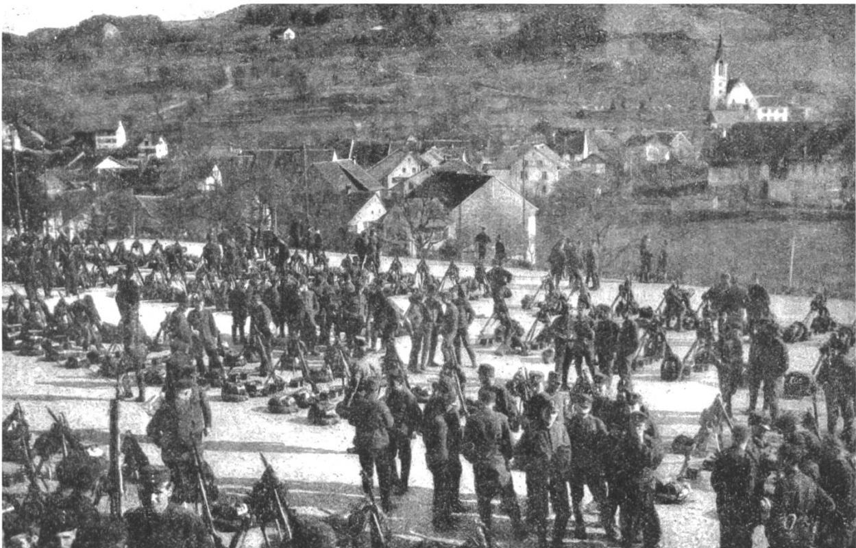
Abb. 1: Der Schulhausplatz als Appellplatz (Repro aus: Howald, Joh., Unser Volk in Waffen. Emmishofen [1916], S.115)

neue Gebäude war 1913 mit Schulzimmern, Lehrerwohnungen, Turnhalle und Schulküche fertig gebaut. Auf den meisten Ansichtskarten ist denn auch das neue Schulhaus, das «Vorzeigebauwerk» Reigoldswils zu sehen. Die in der Turnhalle einquartierten Truppen bezogen also eine