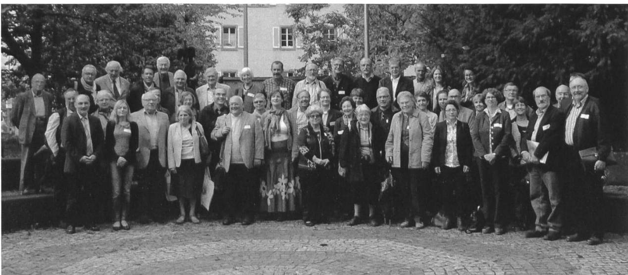
Teilnehmer beim Treffen des Netzwerks Geschichtsvereine am Oberrhein im Dreiländermuseum Lörrach.

Dem Netzwerk ist es in den vergangenen zwei Jahren gelungen, eine Adressdatenbank mit mehreren hundert Geschichtsvereinen am Oberrhein aufzubauen und eine informative Website zu gestalten. Ein regelmäßiger Newsletter informiert über grenzüberschreitend interessante Aktivitäten der Vereine und wichtige Publikationen. Zu den Aktivitäten des Netzwerks gehörten nach der Gründungsversammlung 2012 in Lucelle im Elsass außerdem das grenzüberschreitende Geschichtskolloquium 2013 in Straßburg sowie zahlreiche Publikationen.