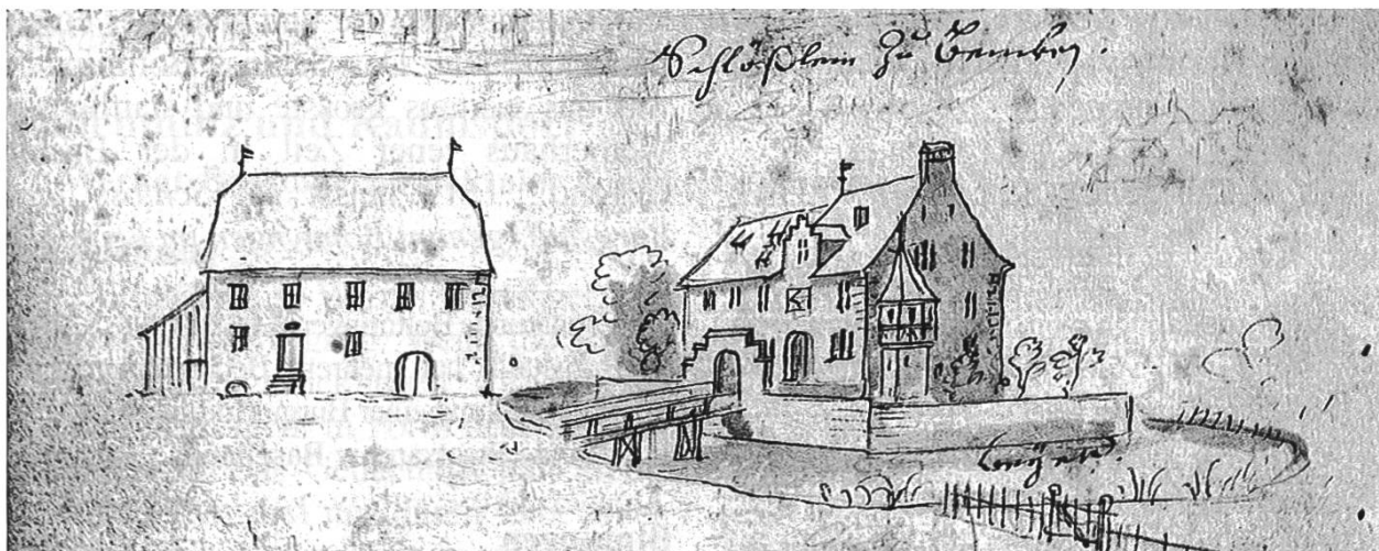
Abb.2: Weiherhaus Benken mit dem Pächterhaus. Zeichnung von Emanuel Büchel 1754. (Repro aus Heimatkunde Biel-Benken, S. 139).

sel, welcher zur Zeit des Gerichts, so Geding genennt wurde, mit seinem Geleite zu Pferd in dem Meyerhof einreiten konnte 3 .