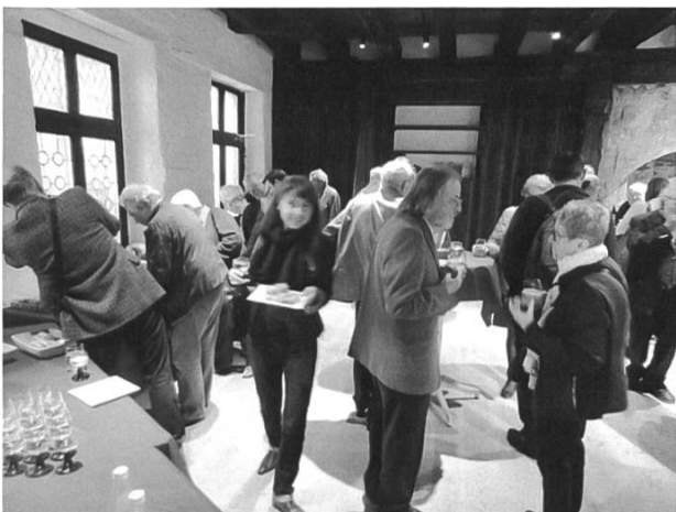
Grenzüberschreitende Kontakte beim Mittagessen am Kolloquium des Netzwerks Geschichtsvereine in Sélestat.