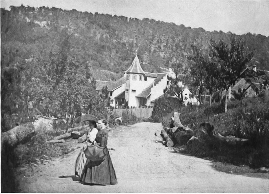
Abb. 2: Liestal; Feldsäge und Feldmühle. Fotograf: Arnold Seiler-Schaub, 1864. Aus: Staatsarchiv Basel-Landschaft. PA 6292, Signatur 01.391. (Die Frauen auf der Fotografie sind der Autorin nicht bekannt.)

in der Nähsschule, und hat auch für den Comfirmanden Unterricht zu schreiben. Es ginge alles gut, was die Geschäfte anbelangt, wenn nur dieß Eine, was noth thut, mehr gesucht würde!» 11 Was dies Eine ist, schreibt sie leider nicht – vielleicht eine moralische Komponente bei den Jungen?