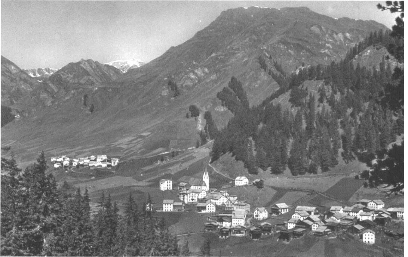
Samnaun-Compatsch (oben), Samnaun-Dorf (unten). Das Aufnahmedatum der Bilder ist leider nicht bekannt.