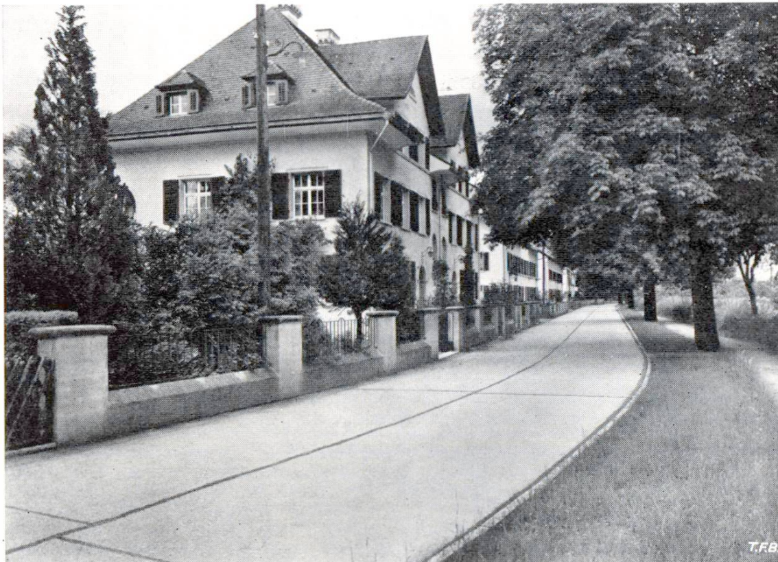
Fig. 3 La rue du canal à Bürklen (Ct. de Thurgovie), construite en 1935; largeur: 5 m Exécution: Georges Oehri, entrepreneur, Bürklen.

Ce sont les raisons pour lesquelles les Routes en béton S. A. préfèrent utiliser, pour les revêtements en macadam-ciment construits sous leur direction, un procédé semblable à celui des revêtements en béton et qui consiste à mélanger intimement le mortier et le concassé dans un malaxeur avant de l'étendre sur la plateforme de la route. La mise en place se fait comme pour les véritables routes en béton au moyen du vibro-dresseur combiné. La proportion de concassé et de mortier est déterminée à l'avance en se basant sur le volume des vides du concassé.