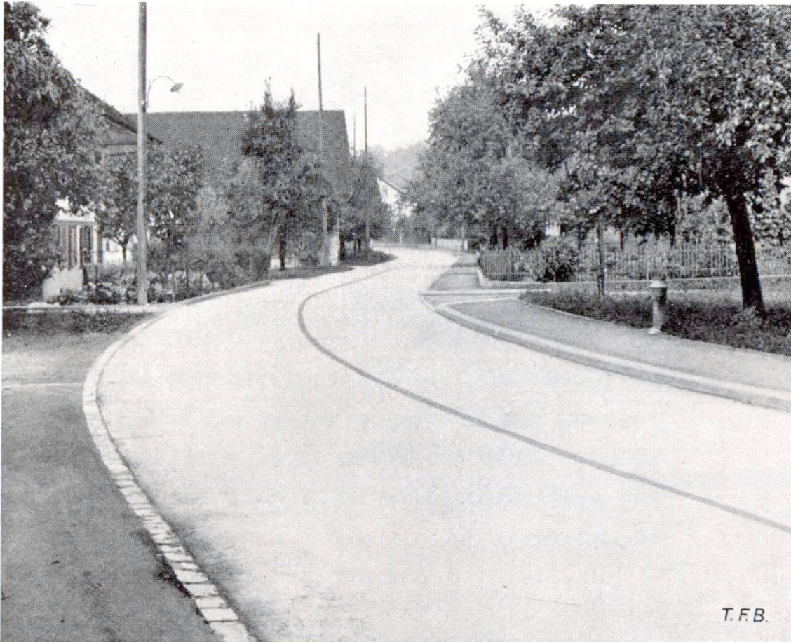
Fig. 1 La route traversant le village de Möriken (Ct. d'Argovie) construite en 1937; largeur: 5—6 m Exécution: Fischer & Co., entrepreneurs, Wildegg.

2 Les qualités de roulement du revêtement en béton sont si remarquables qu'on ne peut être surpris de voir l'importance qu'il prend aujourd'hui dans tous les pays lors de la construction des grandes artères routières. Le revêtement en béton présente une adhérence irréprochable et il est clair la nuit, même sous la pluie. Ces propriétés éminentes sont estimées à leur juste valeur, non seulement des conducteurs de véhicules à moteur, mais aussi de tous les autres usagers de la route, car ces derniers sont certains d'être aperçus à temps par les conducteurs circulant très vite, même si la nuit est très noire et s'il pleut à verse. La bonne visibilité du revêtement en béton par tous les temps augmente la sécurité du trafic, ce qui est vivement à désirer vu l'augmentation incessante des accidents de la route.