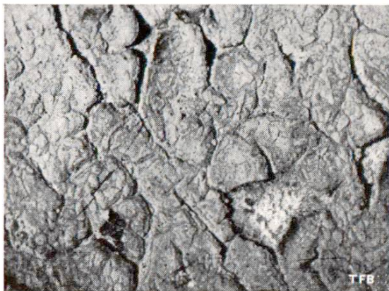
Fig. 1 Défectuosité d'une peinture à l'huile, appliquée sur une surface de béton à réaction alcaline — on a omis de traiter la surface de béton avant de la peindre.

5. Peinture à l'huile: — huiles organiques et colorants — Une peinture à l'huile n'est durable que sur les mortiers et sur les bétons dont le durcissement est suffisamment avancé parce que la chaux libre et les sels alcalins contenus dans le ciment saponifient les couleurs à l'huile (désagrégation chimique de la peinture et de la couche de mortier sous-jacente, boursouffures de la pelli-