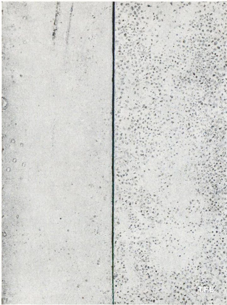
Fig. 4 Essai d'arrosage avec de l'eau de pluie sur les mortiers de ciment Portland 1:3. A gauche, sans arrosage. A droit, après l'effet d'un arrosage correspondant à une quantité de pluie tombée en 100 ans