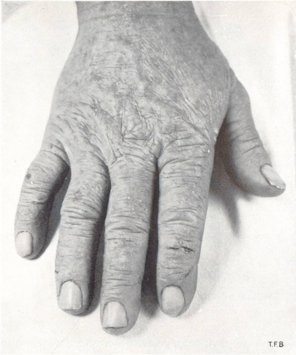
Fig. 3 Eczéma chronique des maçons. Peau épaissie, fendillée et s'écaillant

Les premiers symptômes d'un eczéma des maçons sont généralement dûs à un contact particulièrement intensif avec du ciment ou de la chaux. Le travail avec un mélange concentré de ciment est dangereux: pose de carrelages, glaçage de chapes en ciment, jointoyage, saupoudrage au ciment. Lors de crépissages et de l'application d'enduits, les mains et le visage peuvent être salis par les mélanges frais de ciment ou de chaux, surtout lorsque les travaux se font dans des puits ou qu'il s'agit de revêtir des plafonds. Les eczémas au visage s'attrapent presque exclusivement dans ce dernier cas parce qu'une partie des matériaux retombe sur le visage tourné vers le plafond. J'ai remarqué à plusieurs reprises qu'un rythme accéléré des travaux conduisait plus fréquemment à des infections dues au ciment. Ceci s'explique par le fait que l'on n'observe plus certaines précautions. L'exécution de maçonneries en briques et surtout le bétonnage présentent moins de risques pour la peau car un contact entre celle-ci et le ciment ou la chaux a moins de chances de se produire.