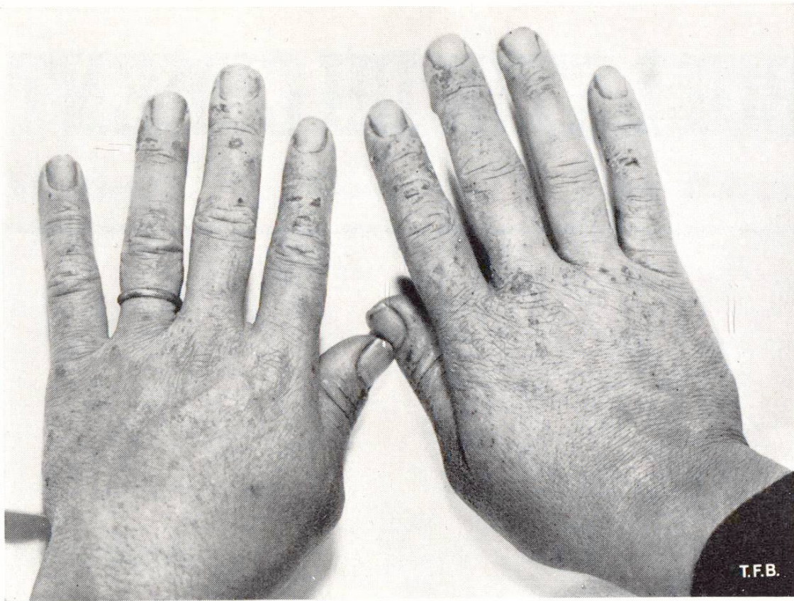
Fig. 1 Eczéma des maçons