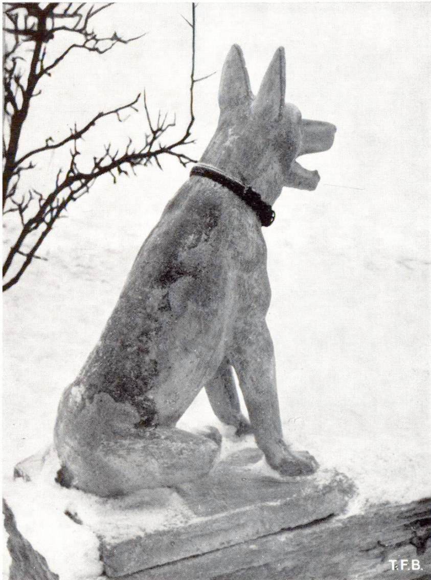
Fig. 7 Oeuvre en béton pour un jardin. Chien, du sculpteur W. Scheuermann, Zürich

En terminant, je voudrais préciser encore une chose pour éviter des malentendus. Les déclarations ci-dessus ne signifient nullement qu'à mon avis le béton soit préférable à la pierre ou au bronze quelles que soient les circonstances. J'ai simplement voulu montrer qu'il offre d'autres moyens aux sculpteurs, et qu'il autorise la création d'œuvres plastiques dans des cas où, sans lui, pour