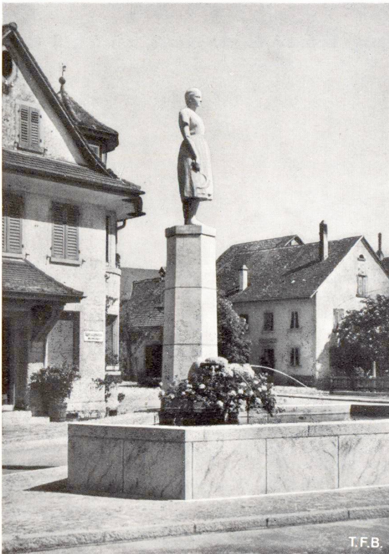
Fig. 3 Oeuvre en béton. Fontaine avec Schaffhouseoise du Klettgau (SH). Sculpteur Max Uehlinger, Minusio

Ceci aussi a déjà donné lieu à de nombreuses discussions. A mon avis, la plastique doit s'adapter et se subordonner au style moderne de la construction. Ainsi peuvent s'expliquer certaines tendances actuelles vers une plastique abstraite et monumentale.