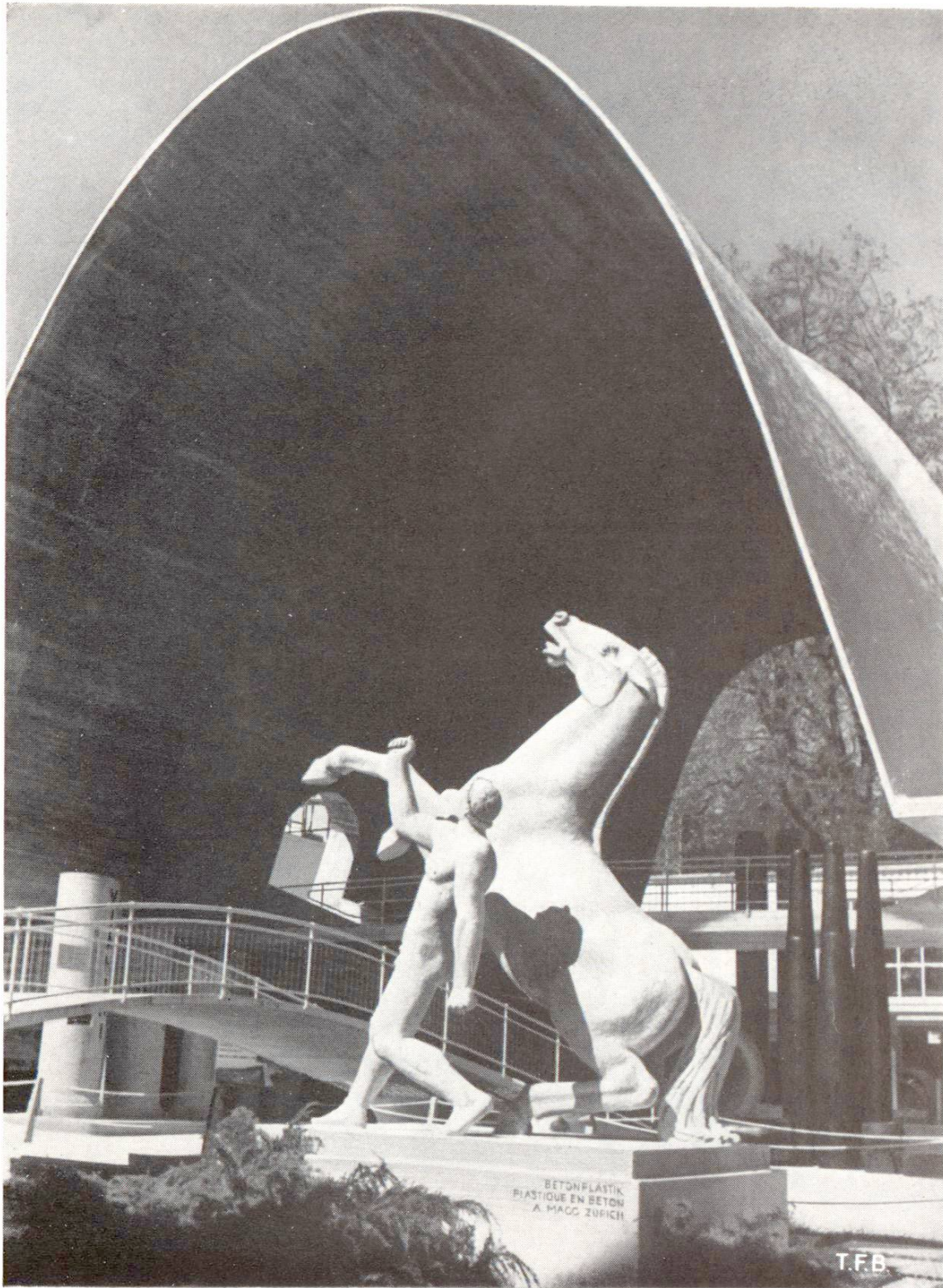
Fig. 5 Oeuvre en béton. Le cheval au dressage, Exposition nationale de 1939 Sculpteur A. Magg, Zürich

un ingénieur qui constata qu'on pouvait parfaitement construire ce groupe dont la stabilité serait assurée, même si on la calculait pour des poids bien supérieurs à ceux de la réalité. Mon travail fut remarqué et commenté par la presse professionnelle, car il constituait une nouveauté dans l'emploi du béton pour une œuvre plastique.