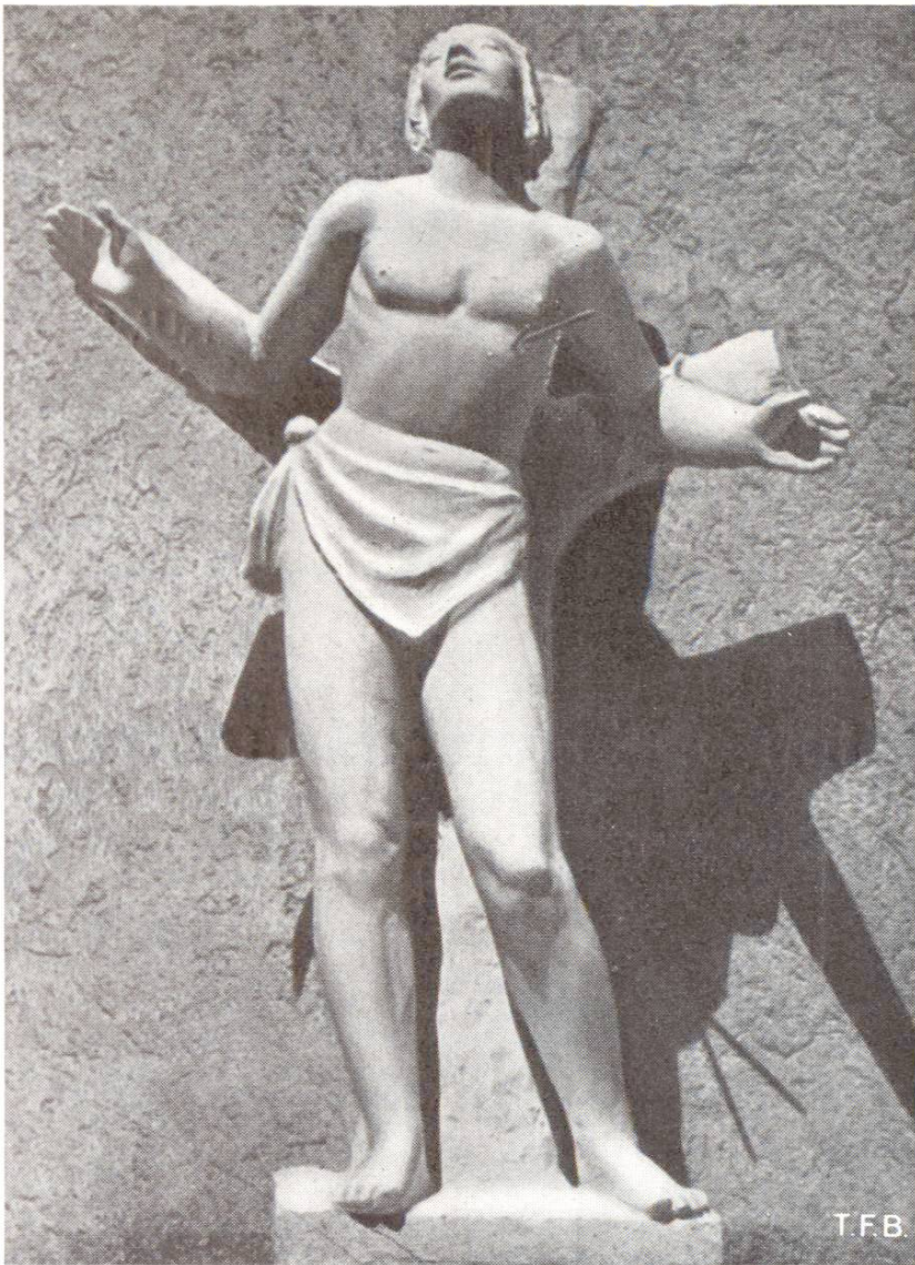
Fig. 2 Oeuvre en béton, St. Sébastien. Eglise à Henau (SG). Sculpteur A. Magg, Zürich

On ne peut à la fois s'envoler et rester sur place, et les belles époques de la sculpture sont peut-être à tout jamais passées.