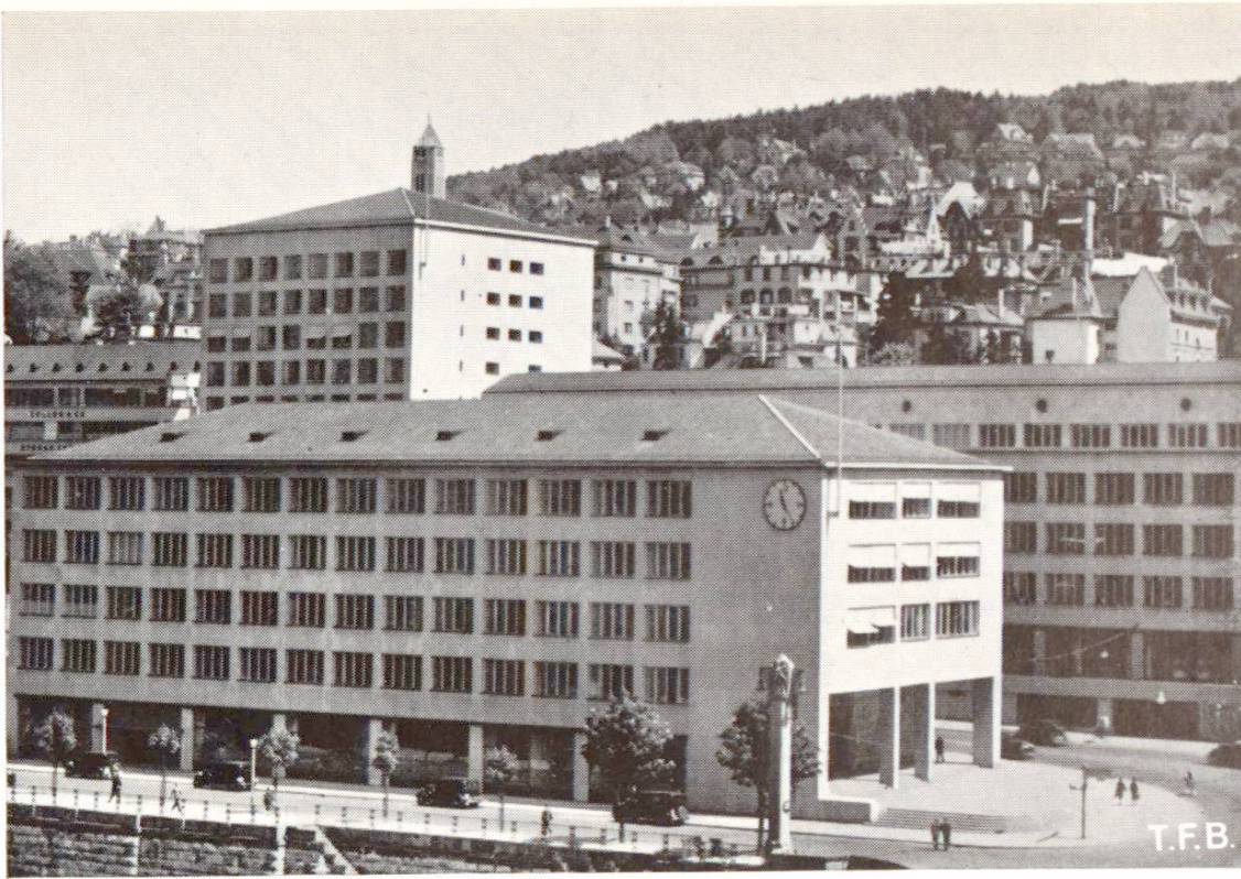
Fig. 3 Bâtiment dans lequel l'emploi de CPHR pour le béton des piliers a permis une avance rapide des travaux

Possibilité de stockage. Sa grande sensibilité et ses réactions rapides rendent le ciment portland à hautes résistances impropre à un stockage de longue durée. Ses qualités diminuent plus rapidement par absorption d'humidité que celles du CP normal (voir BC 1943/14).