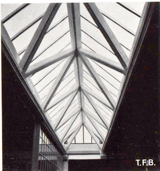
Fig. 2 Charpente en béton armé avec CPHR. S.B.Z., 113. (1951)