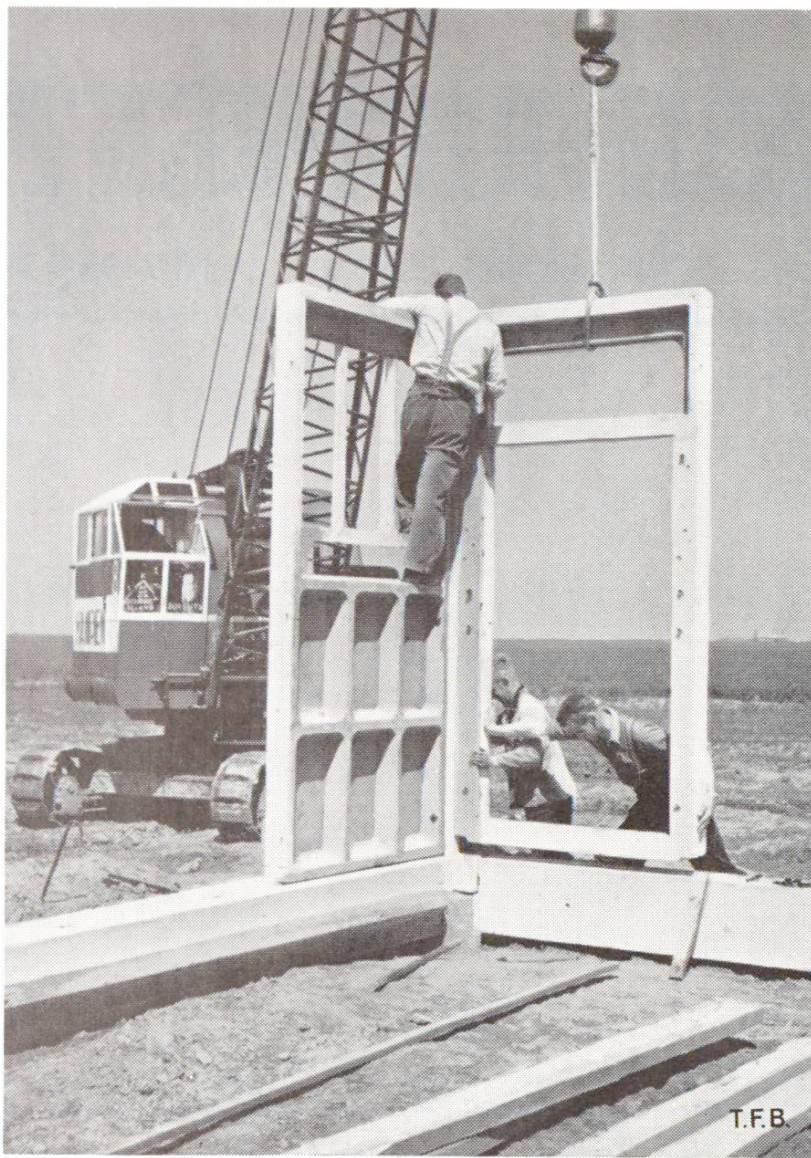
Fig. 1 Construction de bâtiments agricoles sur les terrains nouvellement conquis sur le Zuidersee (Hollande). Une petite grue facilement mobile est utilisée pour le montage des éléments de parois

de plus consiste à diminuer le nombre des domaines en agrandissant certains d'entre eux qui sont bien équipés, par l'adjonction de petites exploitations non rentables dans les conditions actuelles. Cette évolution se manifeste déjà et a bien des chances de s'accélérer. Des améliorations de ce genre augmentent fortement la rentabilité d'une exploitation agricole. Dans des fermes plus grandes, on peut pousser l'industrialisation de l'exploitation ce qui permet de réduire la main-d'œuvre si onéreuse.