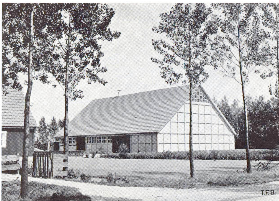
Fig. 5 C'est par milliers qu'on a déjà construit et qu'on construira encore de telles fermes dans les polders du Zuidersee

Le but principal est celui de la réalisation d'étables solides et bien isolées en éléments préfabriqués. Un élément de paroi risque d'être trop lourd. On peut imaginer alors qu'il soit formé de deux éléments identiques, l'un pour l'extérieur l'autre pour l'intérieur, formés chacun par une combinaison béton-terre cuite ou béton-plastique. La liaison transversale pourrait se réaliser au moyen de plaques minces en plastique renforcé de fils. Le problème se simplifie sensiblement si l'étable est un bâtiment séparé, sans surcharge des parois et plafonds.